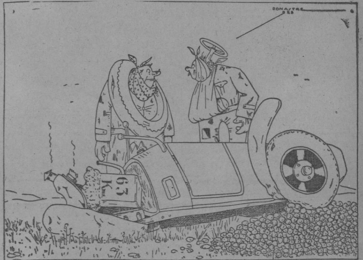
Ahora comprendo que tenías mucha razón, cuando me decías que tu coche devoraba los kilómetros...