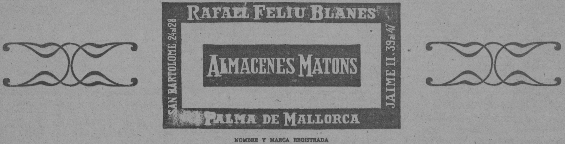
NOMBRE Y MARCA REGISTRADA

No deje de visitar nuestra SUCURSAL de la calle de Colón durante estos días y nos lo agradecerá