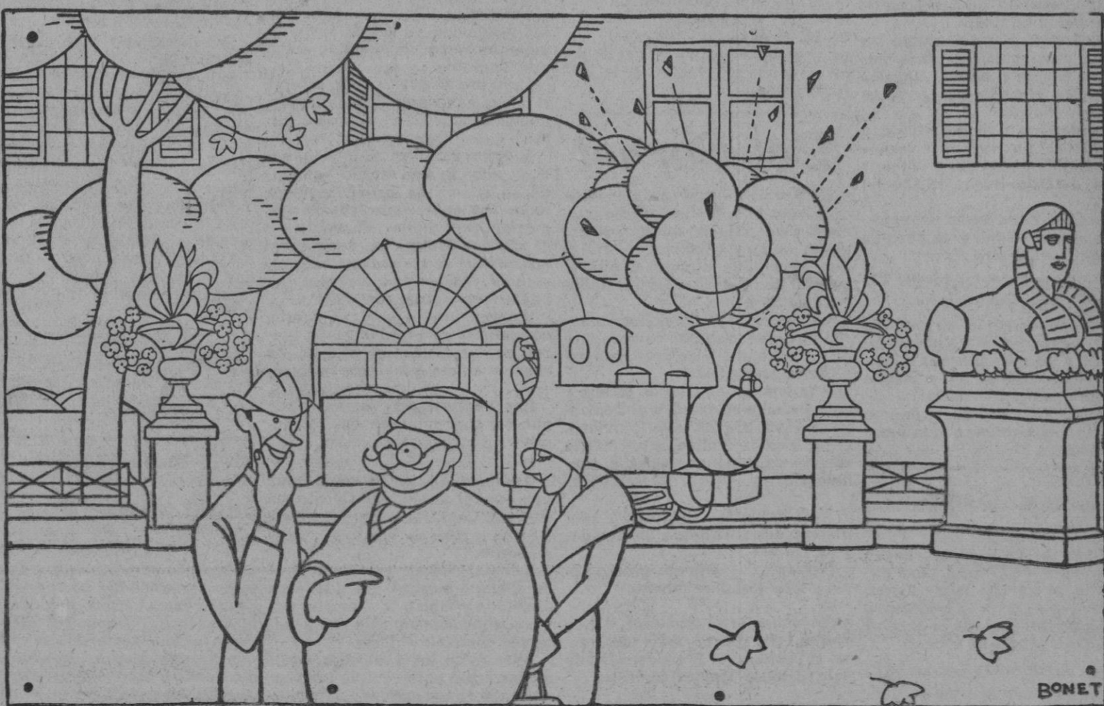
—Porqué mi hijo, además, sabe hablar seis lenguas. —¿Y sabe caillar en las seis?