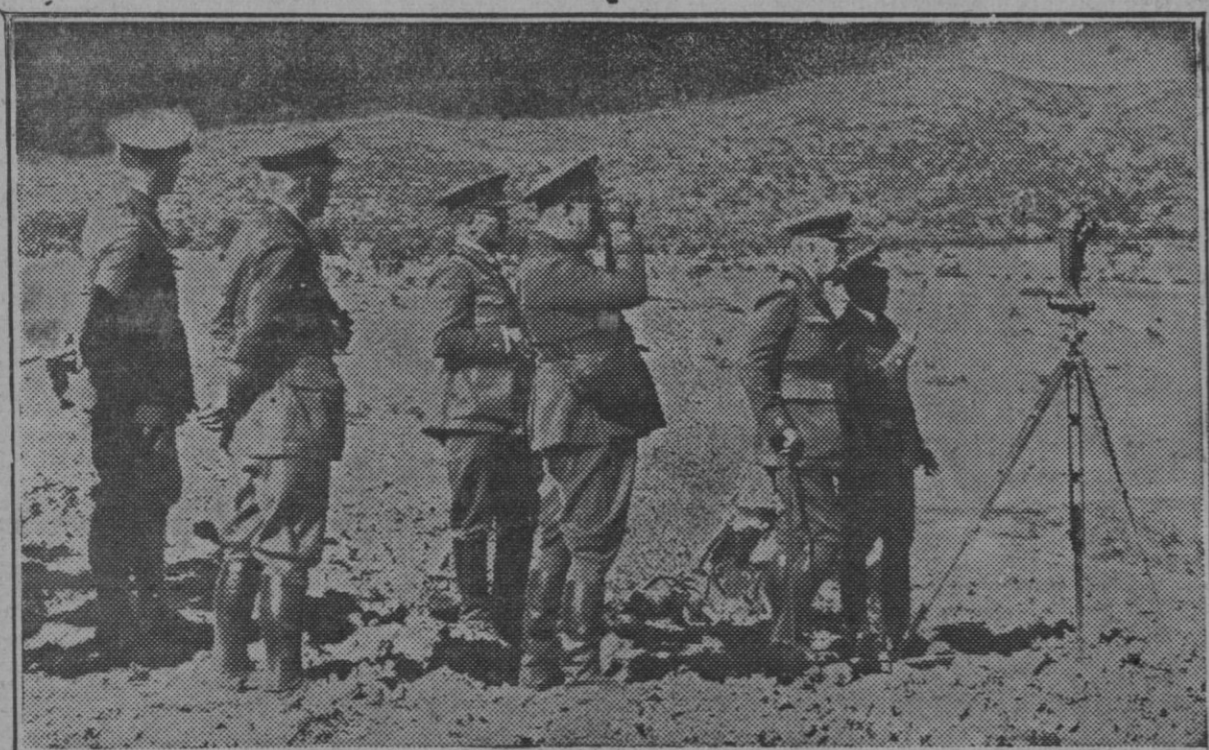
El Infante Don Carlos presencia desde el puesto de mando el avance de las tropas, final de las prácticas