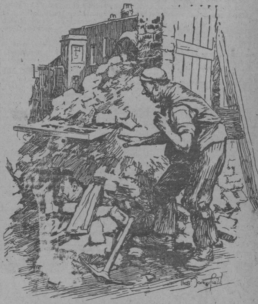
Aguárdate un momento, no te muevas que voy a buscar la ambulancia.