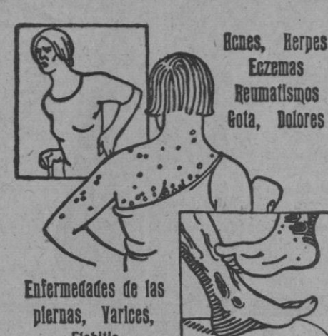
Enfermedades de las piernas, Varices, Fiebrilis