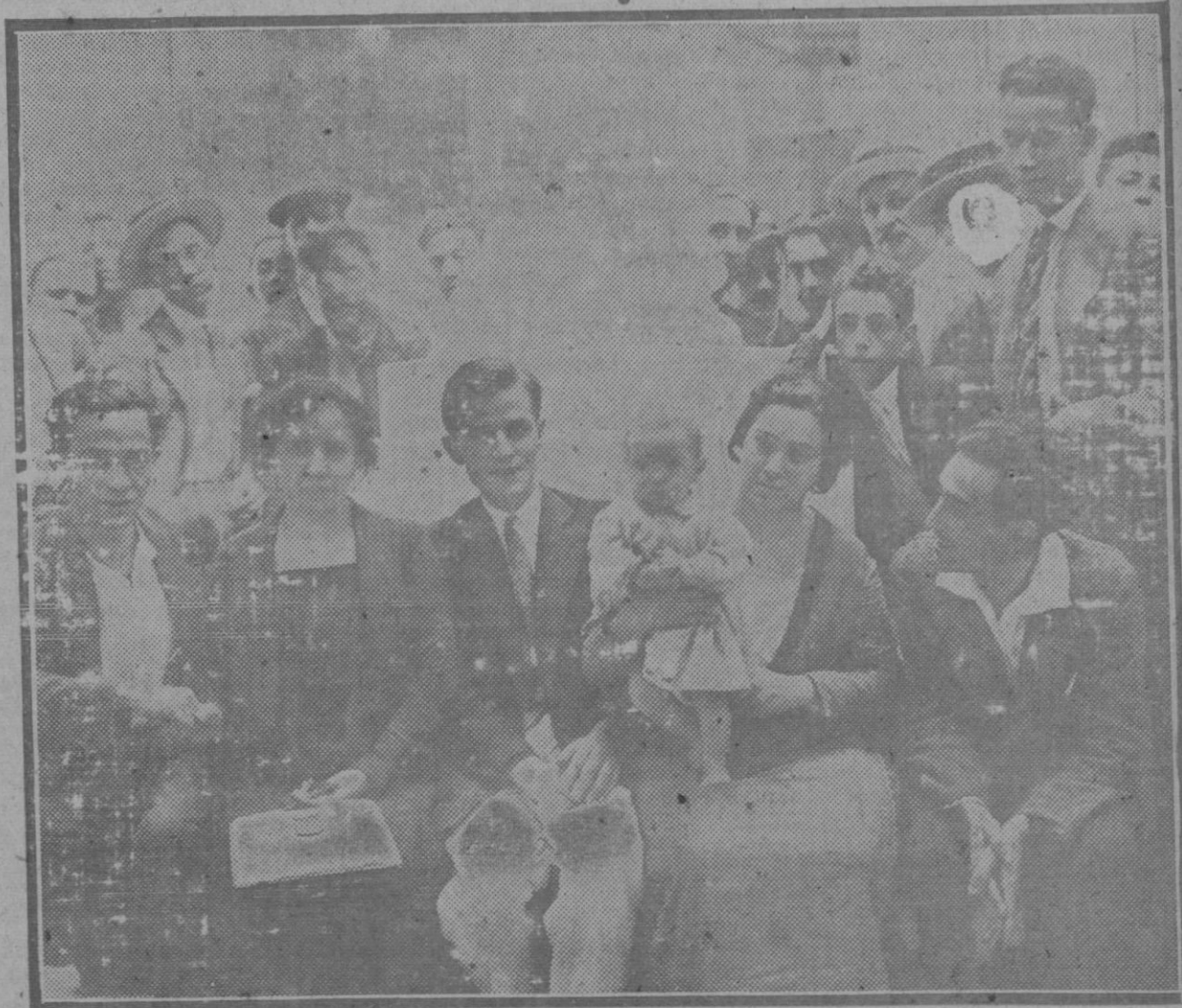
El matrimonio Llorens, de Valencia, al hacerse cargo de su hijo en el Juzgado