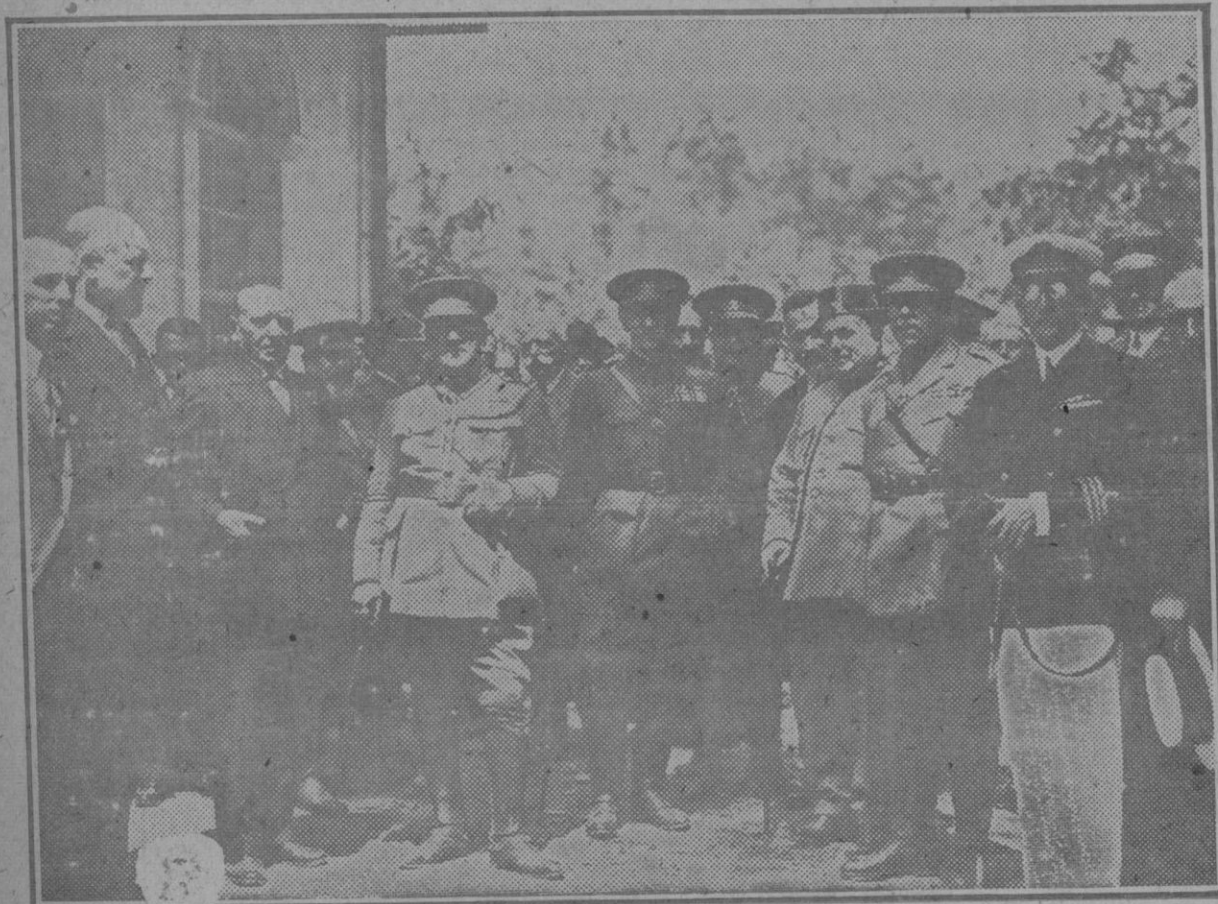
Pontevedra.—El general Martínez Anido rodeado de las autoridades y personalidades que asistieron al banquete celebrado en su honor