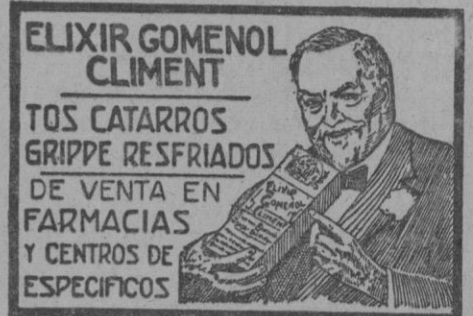
Depositarlos: Establecimientos Dalmau Oliveres S. A., Palma.

Advertimos a nuestros comunicantes que toda la correspondencia relativa al periódico, excepto la administrativa, debe ir dirigida a la Dirección del mismo.