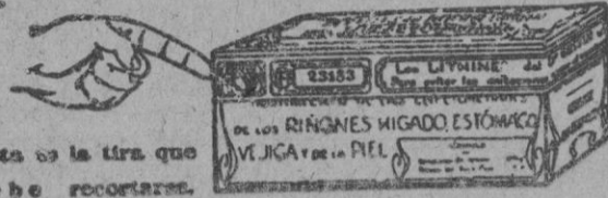
Esta es la tira que debe recortarse.

Los premios se repartirán por orden del mayor número de bandas que se remitan. Mínimum de envío, 25 bandas con el número.