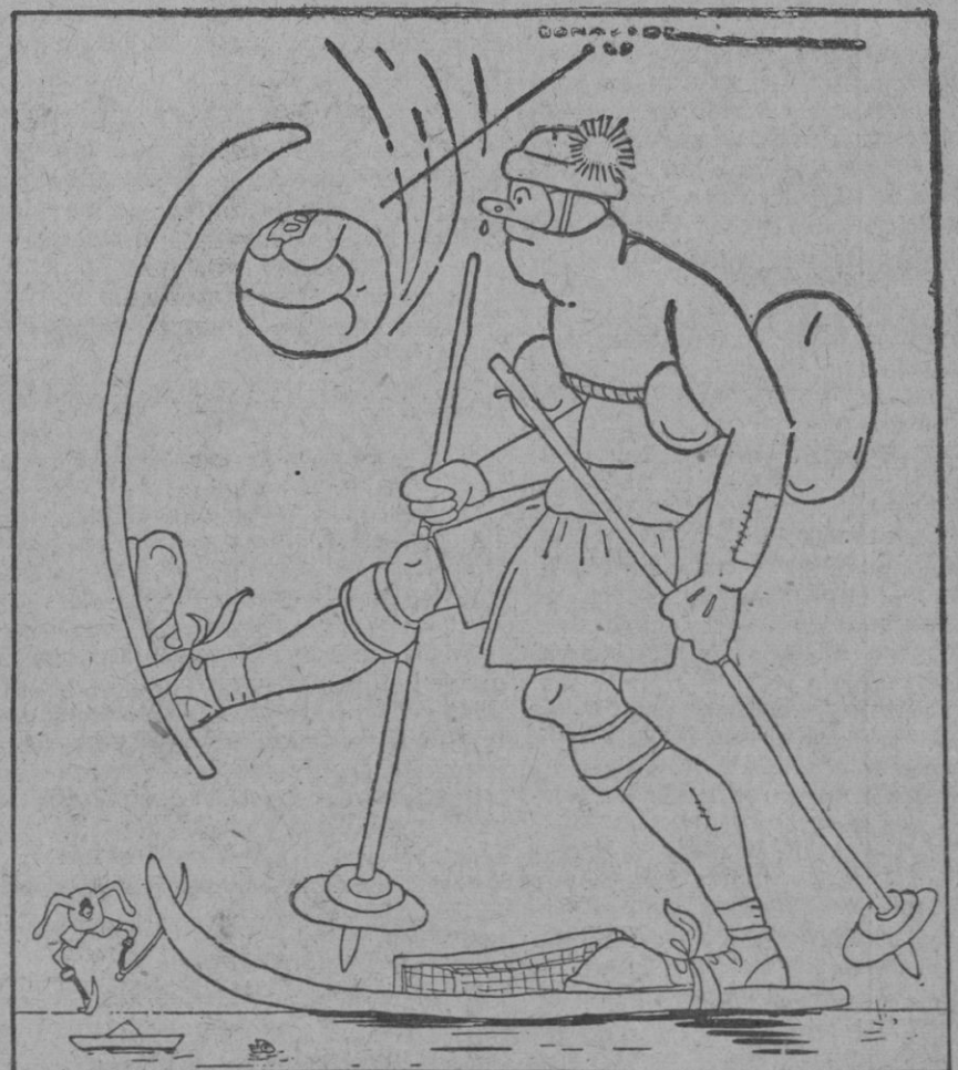
Equipo Invenido, único infalible para campos... de serrín