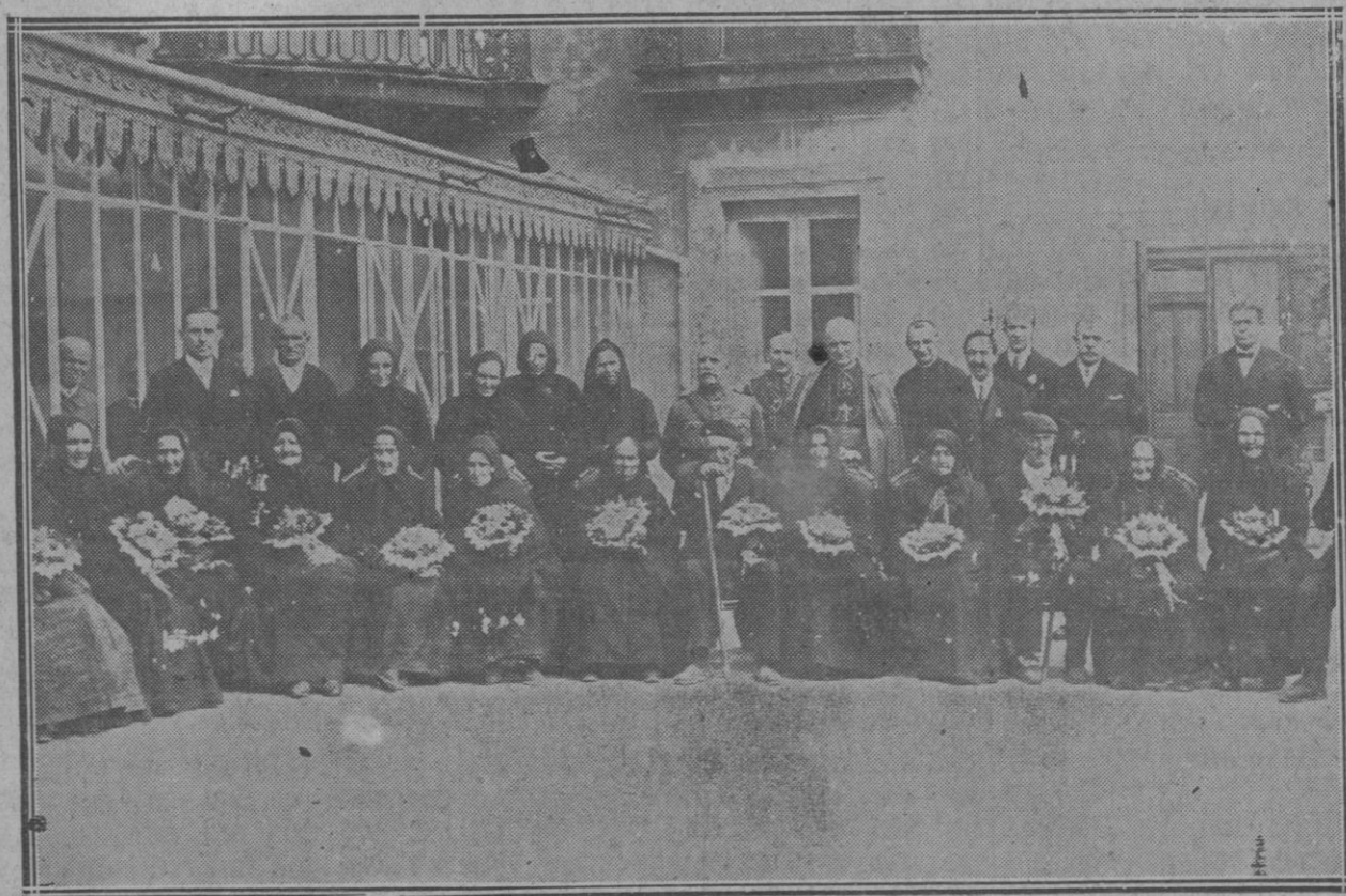
Ancianos y ancianas, acompañados de las autoridades, que concurrieron a dicho acto para obtener la subvención que se concede a los que tienen más de ochenta y cinco años.