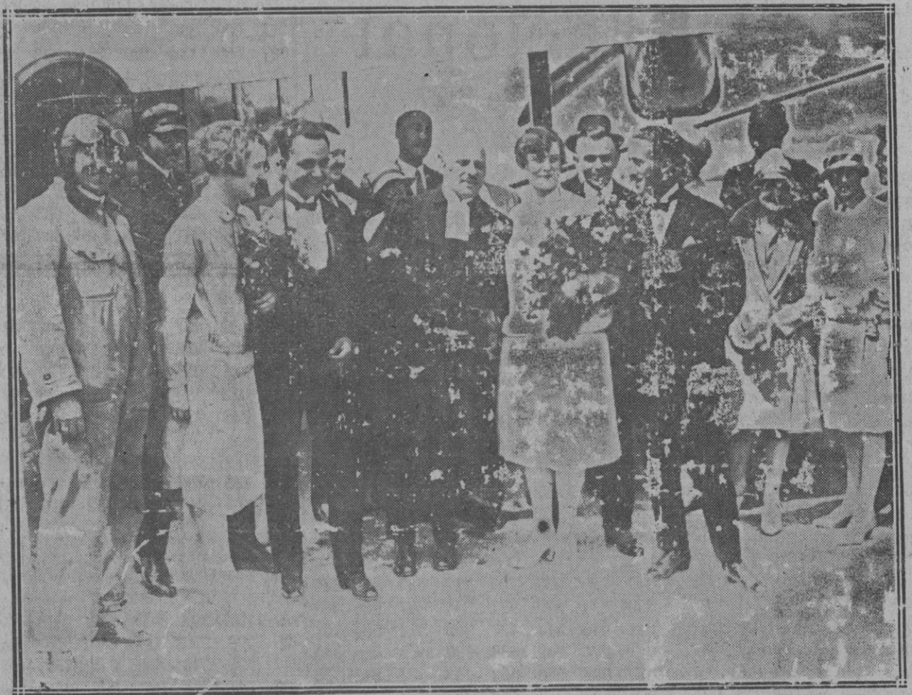
El intrépido pastor protestante autor de la novedad que ofrecemos en grabado con las dos parejas que «remontaron el vuelo» inmediatamente de celebrada la boda, parece muy complacido de su invención. ¿Seguirá en la misma actitud después de haber sido suspendido en sus funciones?