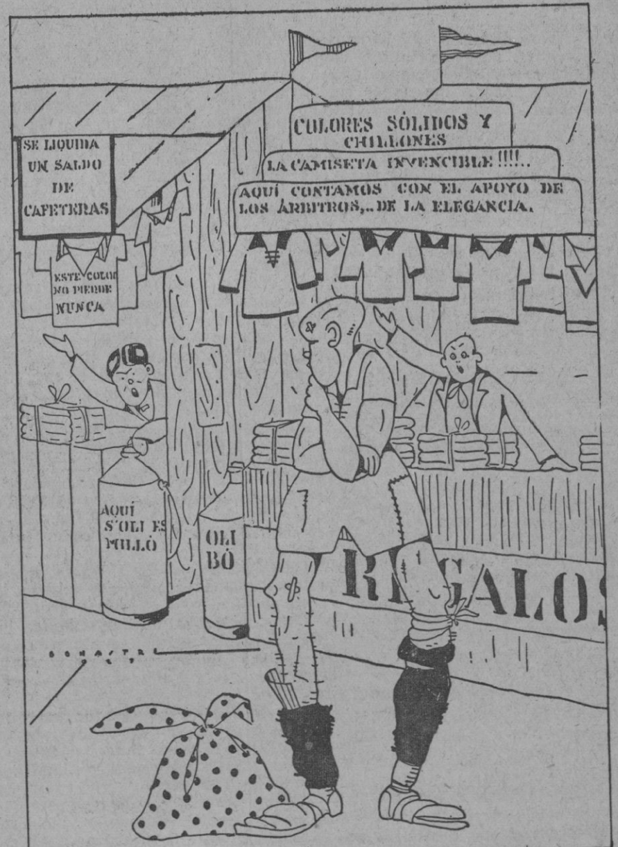
La feria anual

Georges Clemenceau, que se encontraba muy grave, está ahora en vias de curación.