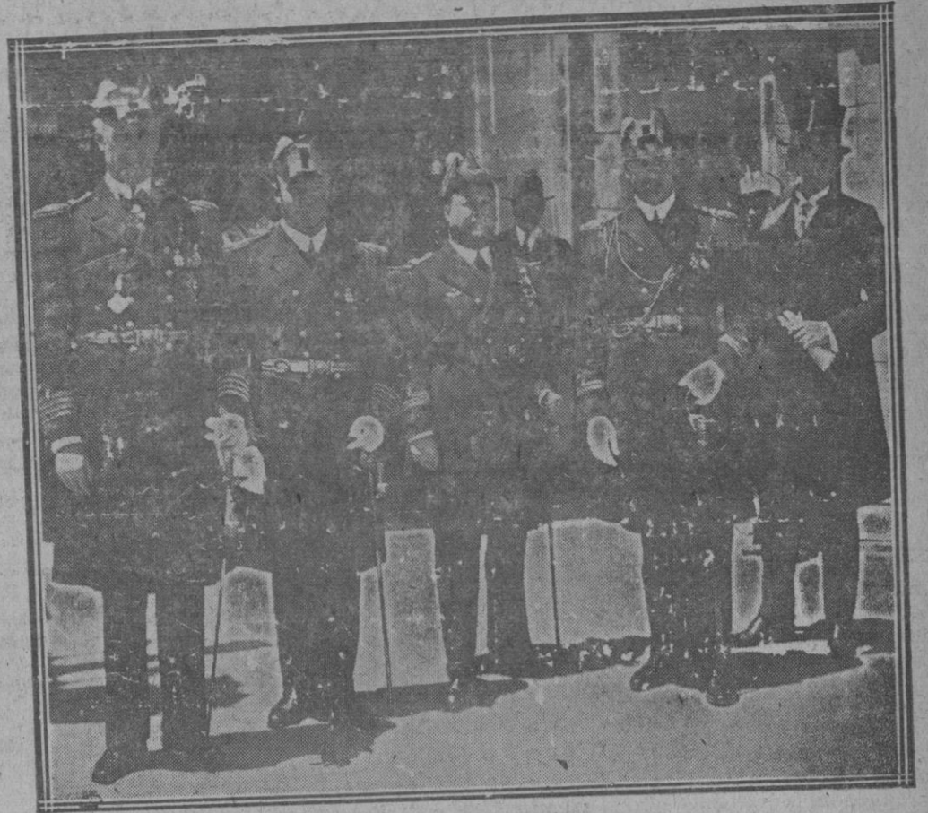
El ministro de Suecia, con los comandantes de los buques suecos que se encuentran en Santander, al salir de Palacio, después del banquete con que fueron obsequiados por Su Majestad el Rey