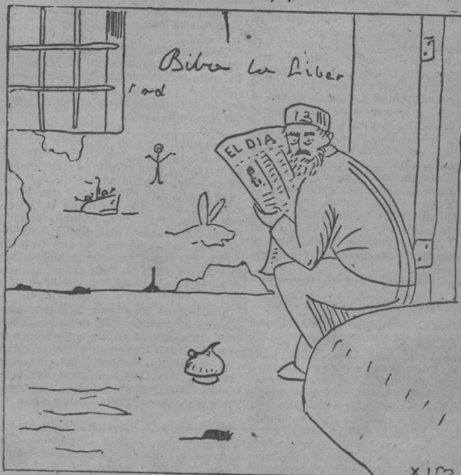
Si por un mes de falta de pago le echan a uno de casa, ¿porqué no me desahucian a mí que hace ocho años vivo aquí sin pagar?