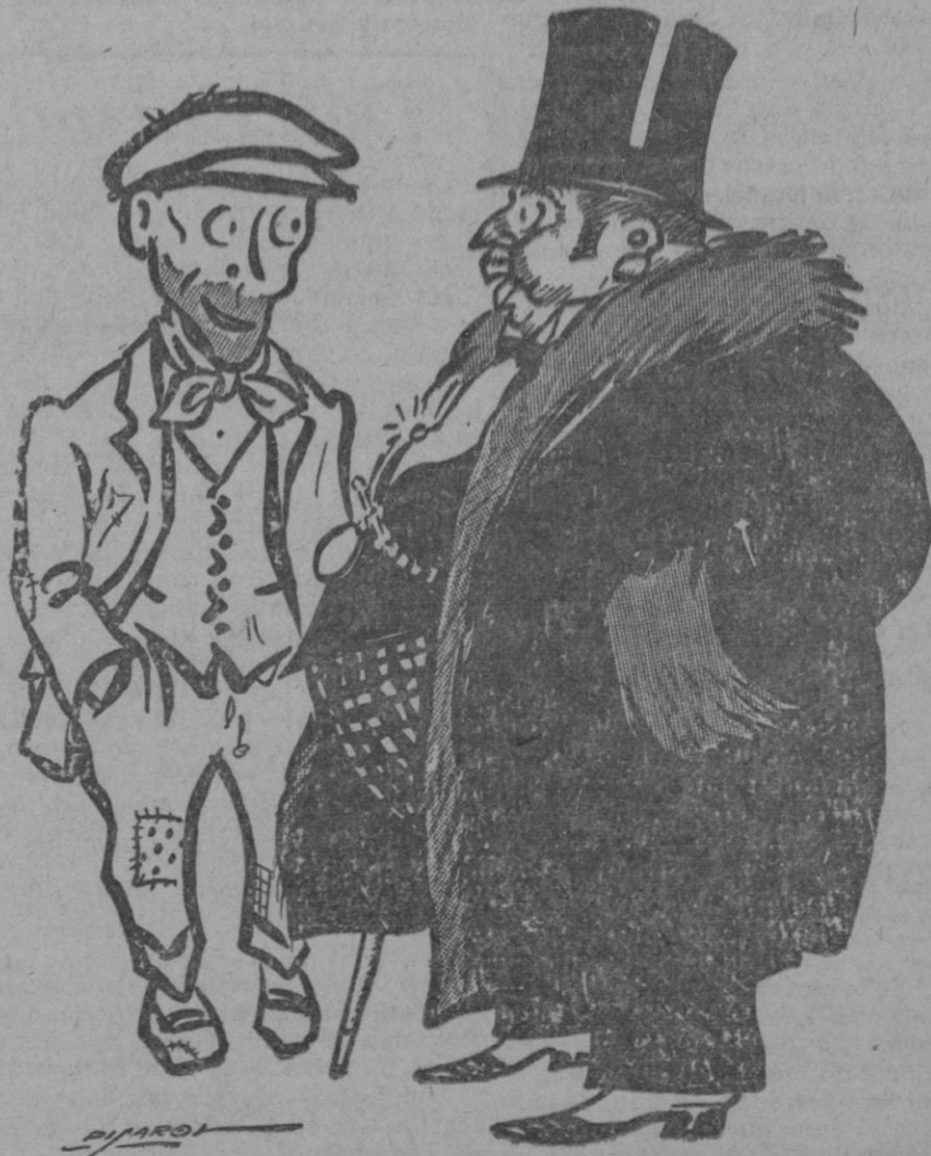
El nuevo rico. — ¡Hay que alimentarse chico!... ¡Muchos huevos!... ¡Muchos pollos!... ¡Muchos bistecs!!!