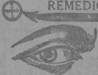
EL OJO DE LA VERDAD

NINGUN REMEDIO conocido hasta hoy ha obtenido tantas curas en España ni en el Extranjero como el MARAVILLOSO