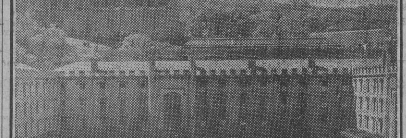
El patio de la Academia Militar de West-Point.

La Academia Militar de los Estados Unidos cuenta actualmente con cinco mil cadetes. Los generales Mac Arthur y Eisenhower, alumnos aprovechados, visitaron la Academia durante su infancia. La Academia Militar de los Estados Unidos cuenta actualmente con cinco mil cadetes. Los generales Mac Arthur y Eisenhower, alumnos aprovechados, visitaron la Academia durante su infancia.