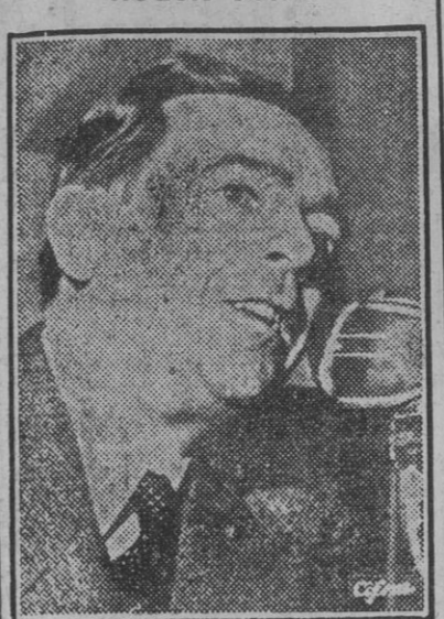
El nuevo alcalde de Nueva York, William O'Dwyer...