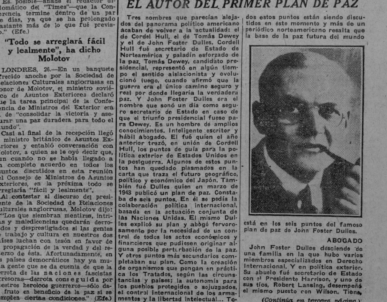
John Foster Dulles desfilando de una familia en la que hubo varios miembros especializados en Derecho Internacional. Y en política exterior. Su abuelo fue secretario de Estado con el Presidente Harrison, y uno de sus hijos, Robert Lansing, desempeñó el mismo puesto con Wilson. Tiene. (Continúa en tercera página).