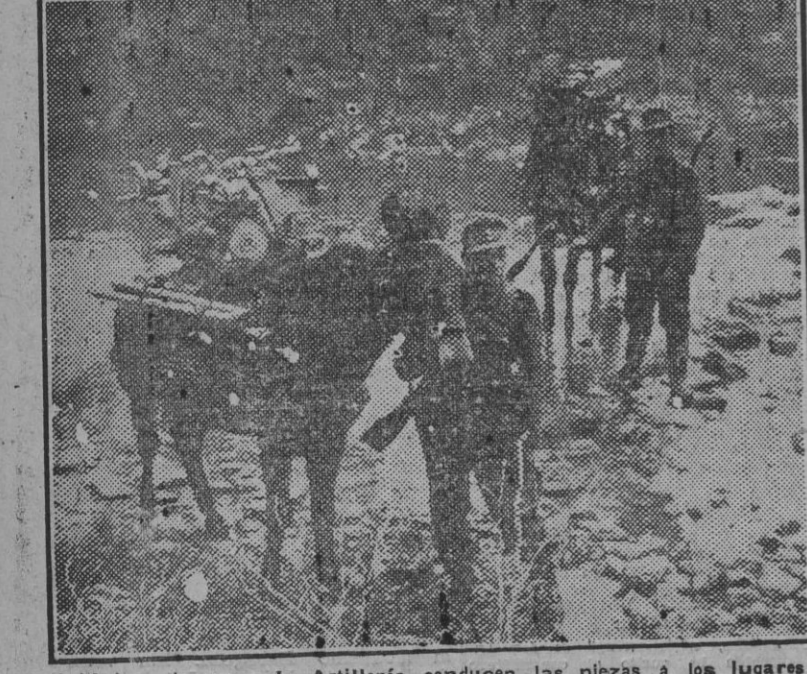
Soldados alemanes de Artillería conducen las piezas a los lugares indicados por el mando.