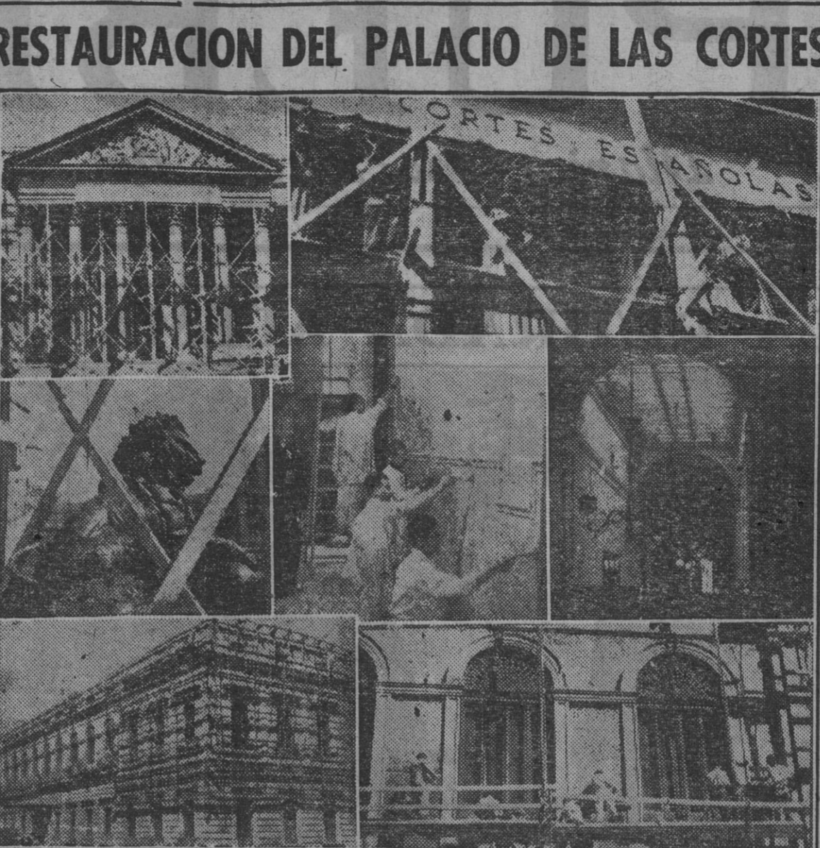
Durante estos días se están llevando a cabo las obras de restauración y pintura del gran edificio de las Cortes. Las fotografías recogen diversas escenas de las tareas emprendidas en el interior y el exterior del palacio.