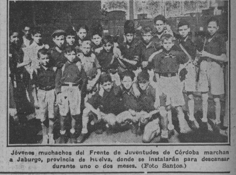
Jóvenes muchachos del Frente de Juventudes de Córdoba marchan a Jabugo, provincia de Huelva, donde se instalarán para descansar durante uno o dos meses.