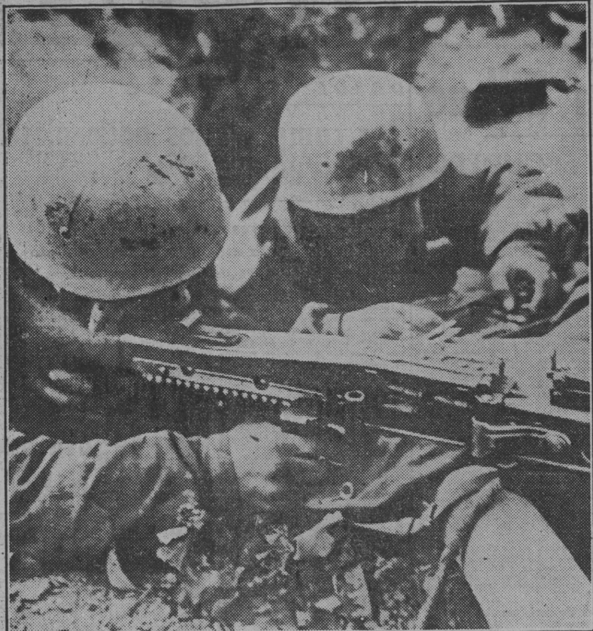
Dois soldados alemanes del batallón "Diablos Verdes" disparan con una ametralladora contra el enemigo, que está a 10 metros de las posiciones.