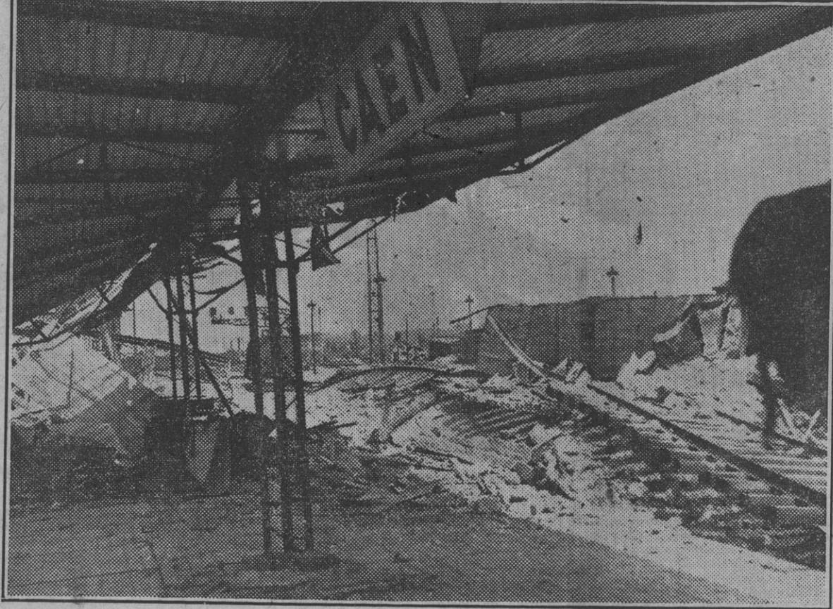
La estación del ferrocarril de Caen tal como quedó después de los intensos ataques aéreos aliados.