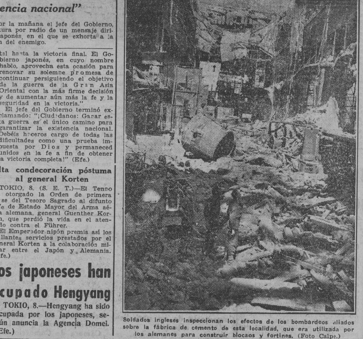
Soldados ingleses inspeccionan los efectos de los bombardeos aliados sobre la fábrica de cemento de esta localidad, que era utilizada por los alemanes para construir bloques y fortines.