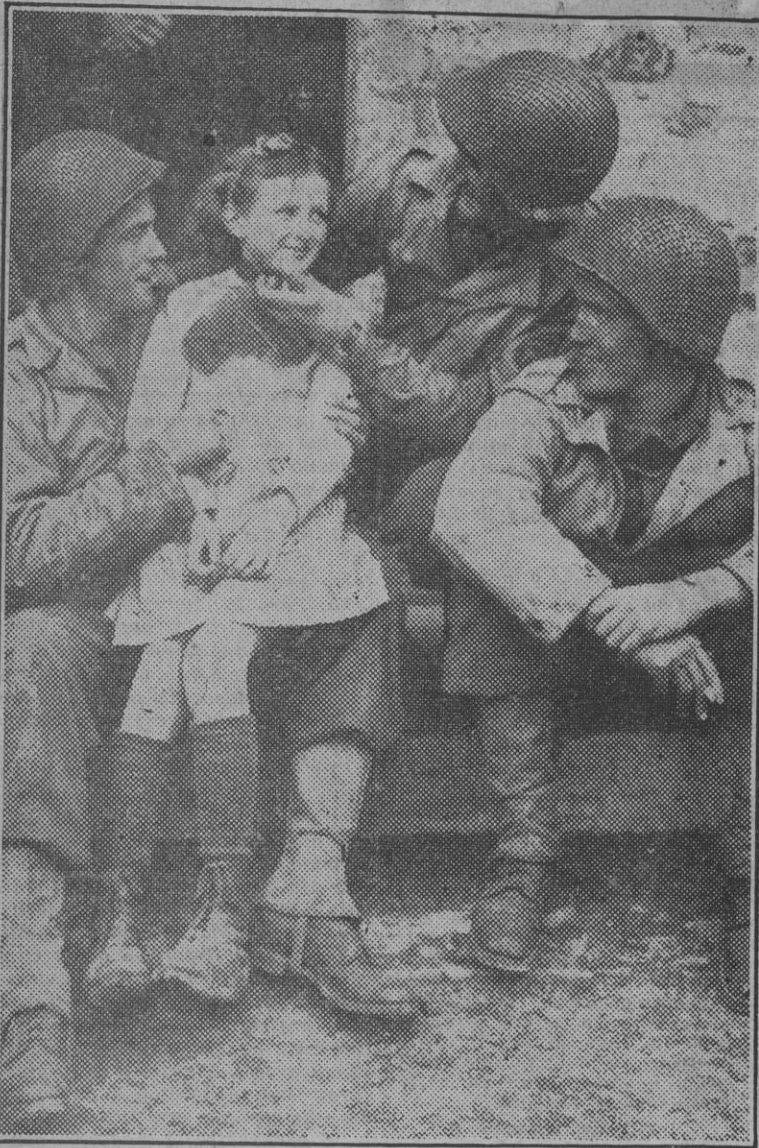
En una de las ciudades liberadas estos soldados norteamericanos entablan amistad con una niña francesa.