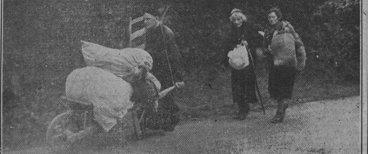
Los moradores de los pueblos normandos aislados por la guerra emprenden su exodo por las carreteras transportando sus imprescindibles enseres.