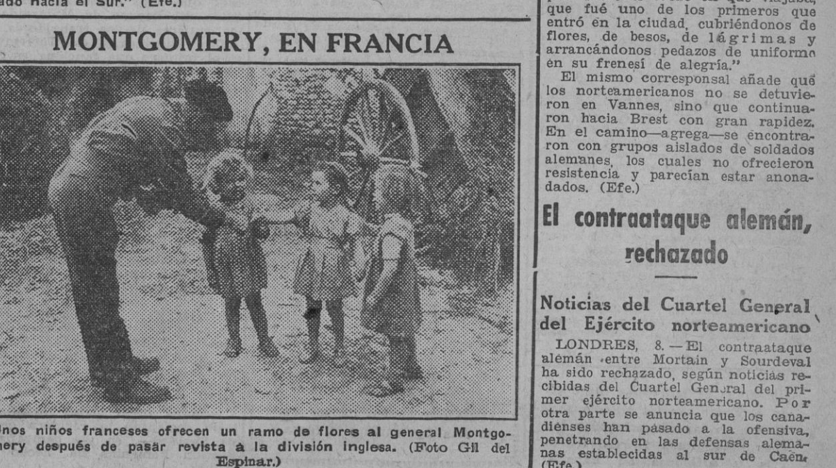
Unos niños franceses ofrecen un ramo de flores al general Montgomery después de pasar revista a la división inglesa.