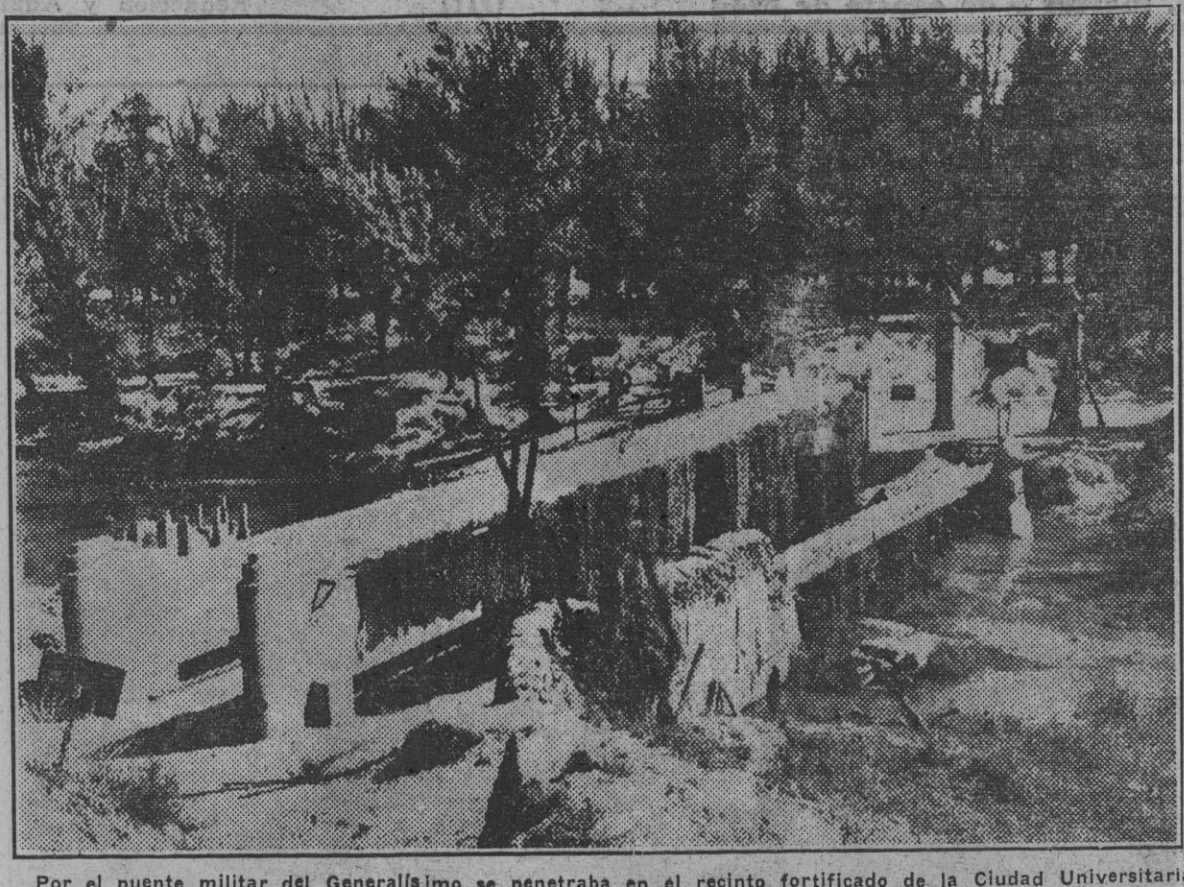
Por el puente militar del Generalísimo se penetraba en el recinto fortificado de la Ciudad Universitaria.