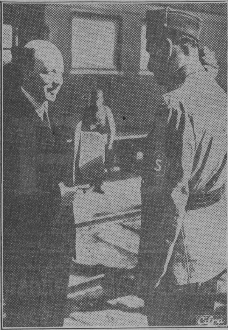
El mariscal Mannerheim ha substituído a Risto Ryti en la Jefatura del Estado finlandés. En la foto aparecen los dos hombres de la actualidad finesa, el militar y el político, conversando en una estación del país nórdico. En la página cuarta de este número publicamos amplia e interesante información.