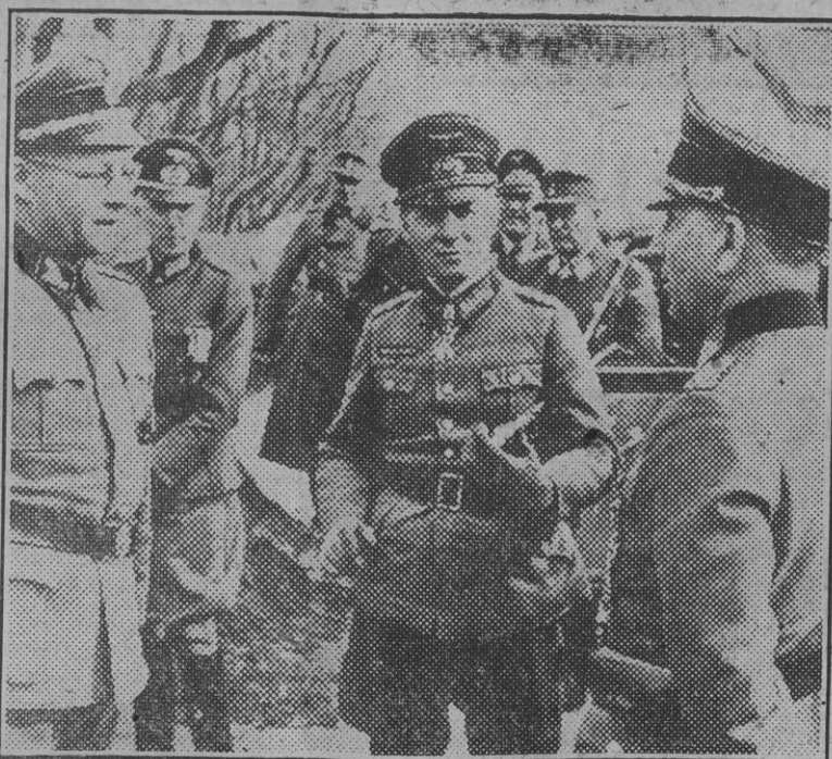
He aquí a Rommel durante una visita de inspección a las costas holandesas.