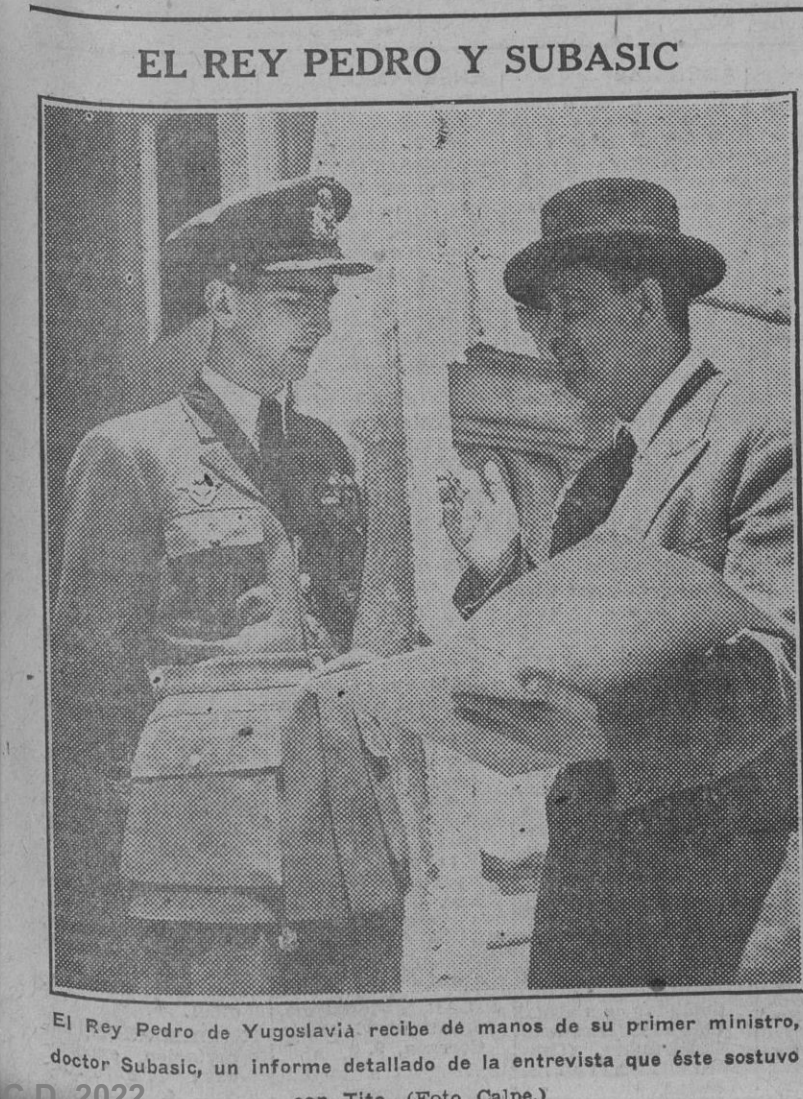
El Rey Pedro de Yugoslavia recibe de manos de su primer ministro, doctor Subasic, un informe detallado de la entrevista que éste sostuvo con Tito.