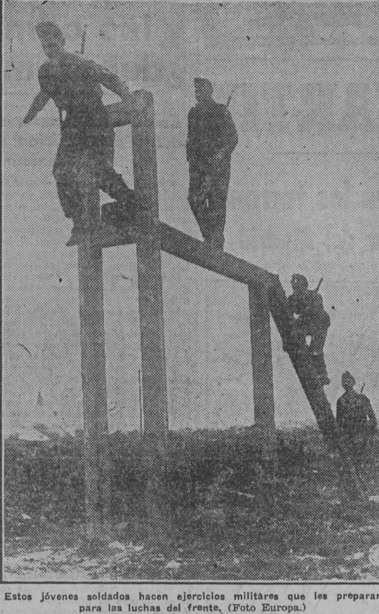
Estos jóvenes soldados hacen ejercicios militares que les preparan para las luchas del frente.