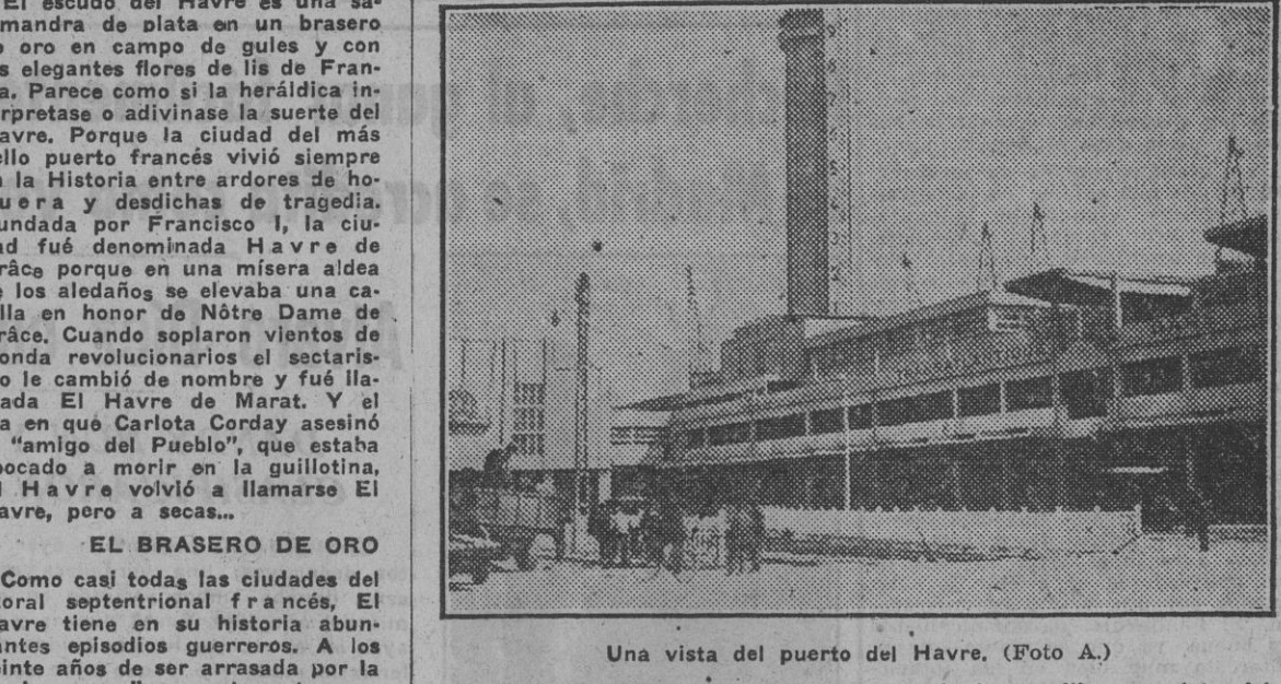
Una vista del puerto del Havre.