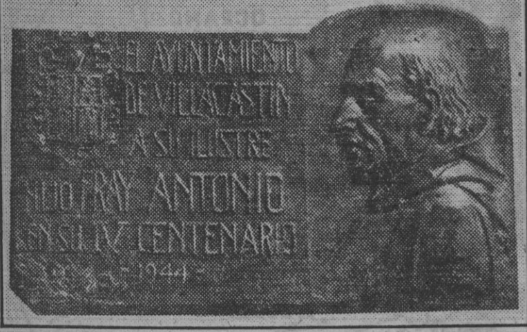
El escultor Florentino del Pilar ha ejecutado esta placa de fray Antonio de Villacastin, que regala al Ayuntamiento de dicha ciudad.

Su IV centenario se celebra el próximo día 2 de julio