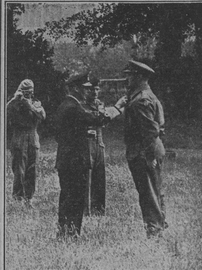
El Rey de Inglaterra, Jorge VI, durante la reciente visita que hizo al frente aliado, condecora a un oficial inglés que se distinguió en los desembarcos.