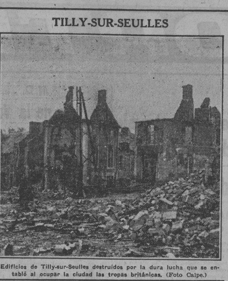
Edificios de Tilly-sur-Seulles destruidos por la dura lucha que se estableció al ocupar la ciudad las tropas británicas.