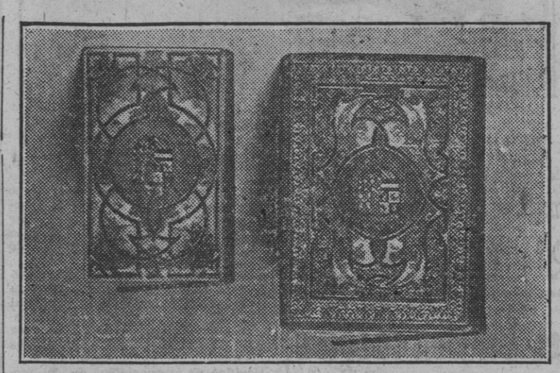
Reproducción del Escorial, siglo XVI, perteneciente a Felipe II...