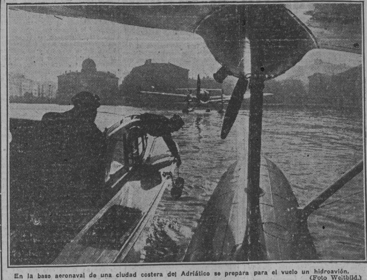
En la base aeronaval de una ciudad costera del Adriático se prepara para el vuelo un hidroavión.