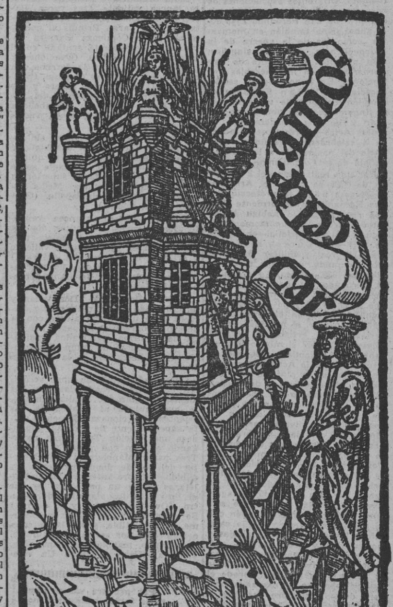
Frontispicio, grabado de líneas no cruzadas en madera, del "Cárcel d'Amor"...