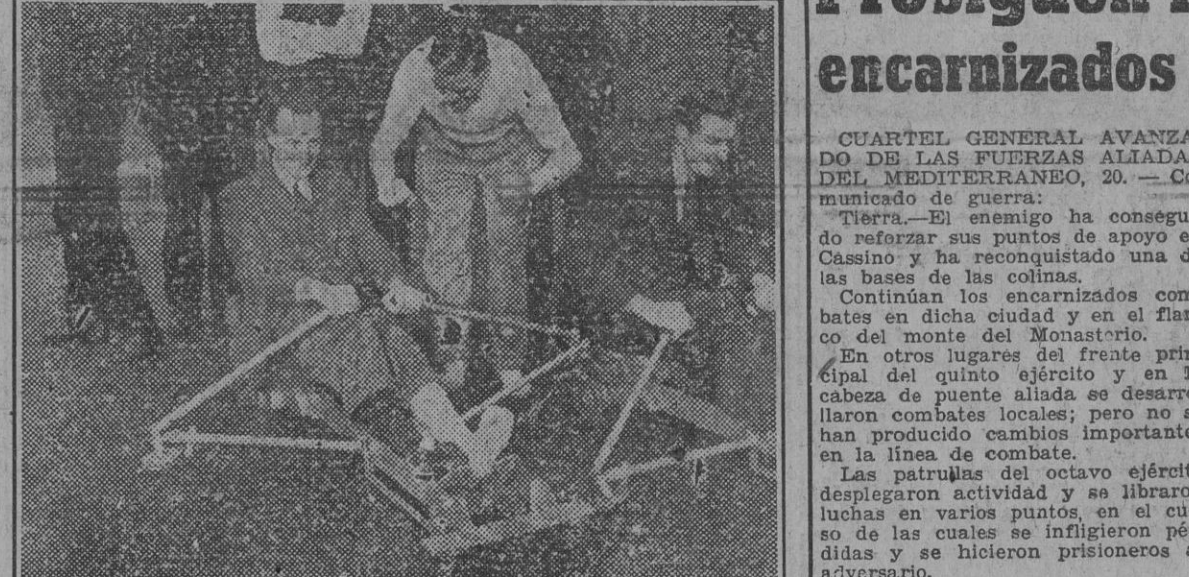
Los obreros ingleses y soldados utilizan estos remos mecánicos para la rehabilitación de los músculos de los enfermos y heridos.