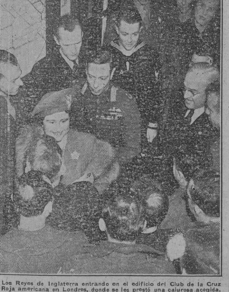
Los Reyes de Inglaterra entrando en el edificio del Club de la Cruz Roja Americana en Londres, donde se les prestó una cálida acogida. (Foto Pando.)

En la noche del 18 de marzo aparos de bombardeo atacaron el cruce de vias de Elodiviv. En toda la jornada fueron destruidos 56 aparos de bombardeo, con la pérdida de gran número de ellos en el suelo. La R. A. F. efectuó unas 2.000 salidas. En el campo de batalla el enemigo hizo aproximadamente 90 salidas." (Efe.)