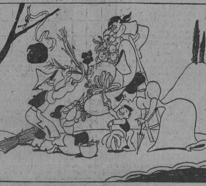
LA RECOLECCION ABUNDANTE, por Bellón.

Más de quince mil fieles participarán en una procesión ALMERIA, 20.—Han dado comienzo las Misiones generales en Almería, organizadas por el obispo de la diócesis. Más de 15.000 personas, que ocupaban totalmente el paseo del Centralismo, acudieron procesionalmente desde la plaza Circular a recibir a los Padres Misioneros. En la presidencia figuraban el gobernador civil y jefe provincial del Movimiento, el gobernador militar, alcalde, presidentes de la Diputación y Audiencia y las restantes autoridades y jerarquías y miembros de todas las asociaciones religiosas portadoras de las cruces aladas y estandartes de la Catedral y de las parroquias.