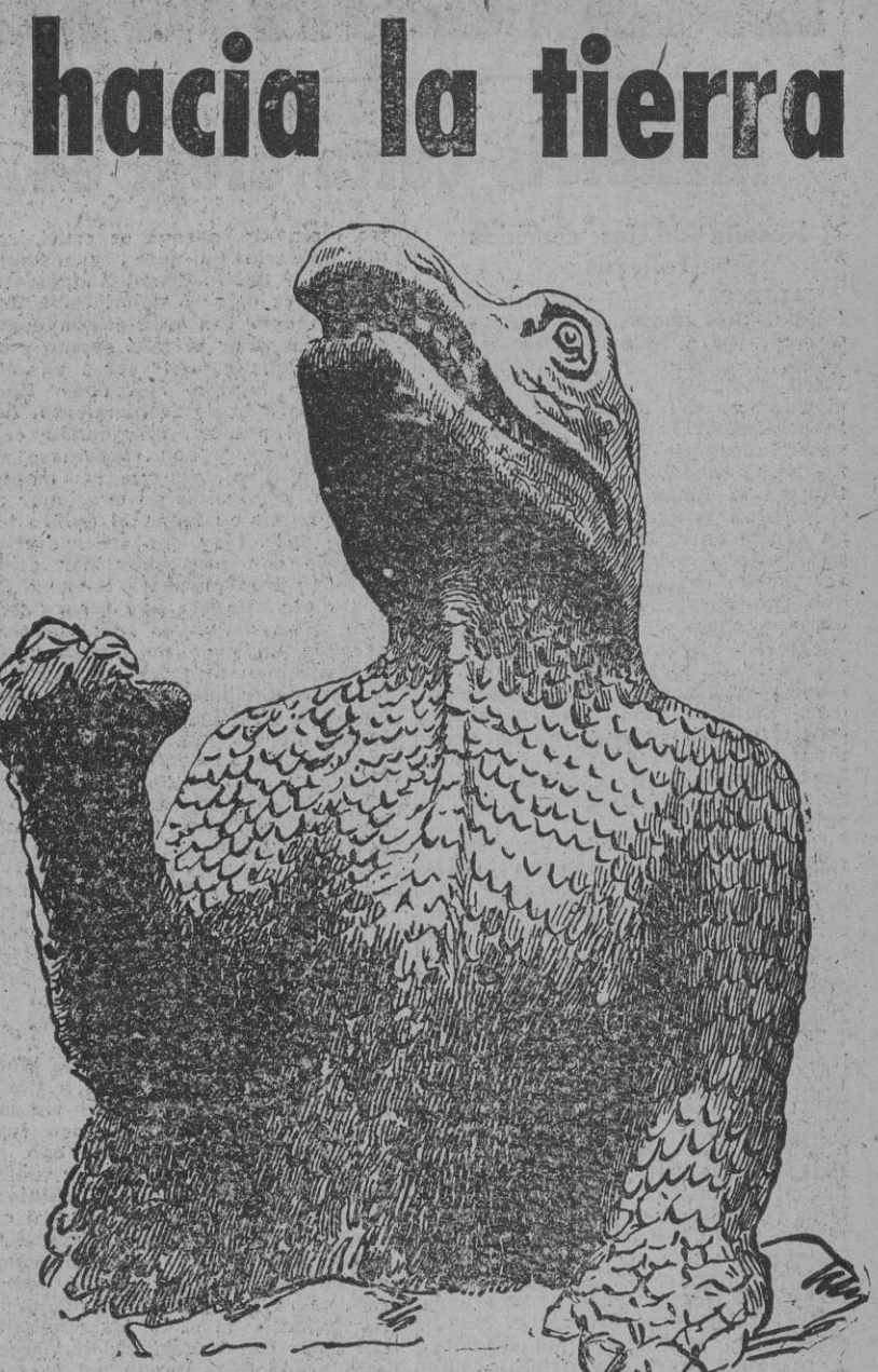
Por el estilo de tan estrafalario reptil prehistórico debía ser el más acreditado de los monstruos contemporáneos: el del lago Ness.

A LOS BIBLIÓFILOS Para no hacer interminable la evocación de las apariciones del teratológico "as" de los moradores abisales, interrumpimos la enumeración de sus salidas a escena. Pero si hemos de sucumbir a la tentación de insertar una breve nota bibliográfica sobre la serpiente de mar. Quien de ella quiera saber innúmeras, amenas y curiosísimas cosas puede consultar—si los encuentra—los siguientes volúmenes: "The Great Sea Serpent", de Quodvultus (1892); "Case for the Sea