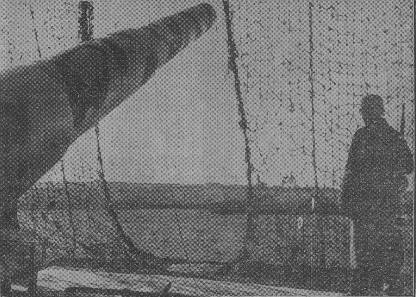
Ante los preparativos de invasión del Continente, y aunque nunca se descuidó, la vigilancia alemana en la costa atlántica es ahora más penetrante que nunca. Junto al colosal cañón costero, el centinela no descuida un momento su guardia.