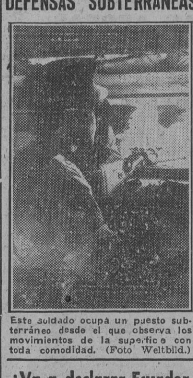
Este soldado ocupa un puesto subterráneo desde el que observa los movimientos de la superficie con toda comodidad.

Resumen de la situación militar en el Este BERLÍN, 30.—Resumiendo la situación militar tal y como se presenta al terminar el año en el frente del Este, Weis escribe en el "Völkischer Beobachter" que en esta guerra "los ejércitos alemanes se han mostrado en todos los frentes muy superiores a sus adversarios. Las fuerzas armadas alemanas, en todas sus ofensivas, no han logrado conseguir una decisión en la batalla ni penetrar ni dividir el frente alemán. El Ejército alemán impuso al enemigo su estrategia táctica, ocasionándole enormes pérdidas en hombres y en material." (Efe.)