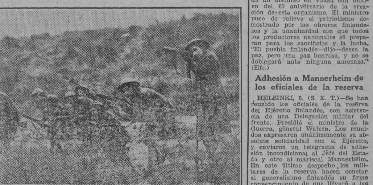
En una escuela militar de Escocia las muchachas polacas se preparan para acudir a la defensa de su patria. Un grupo de ellas, en ejercicios de prácticas, salva el obstáculo de las alambradas.