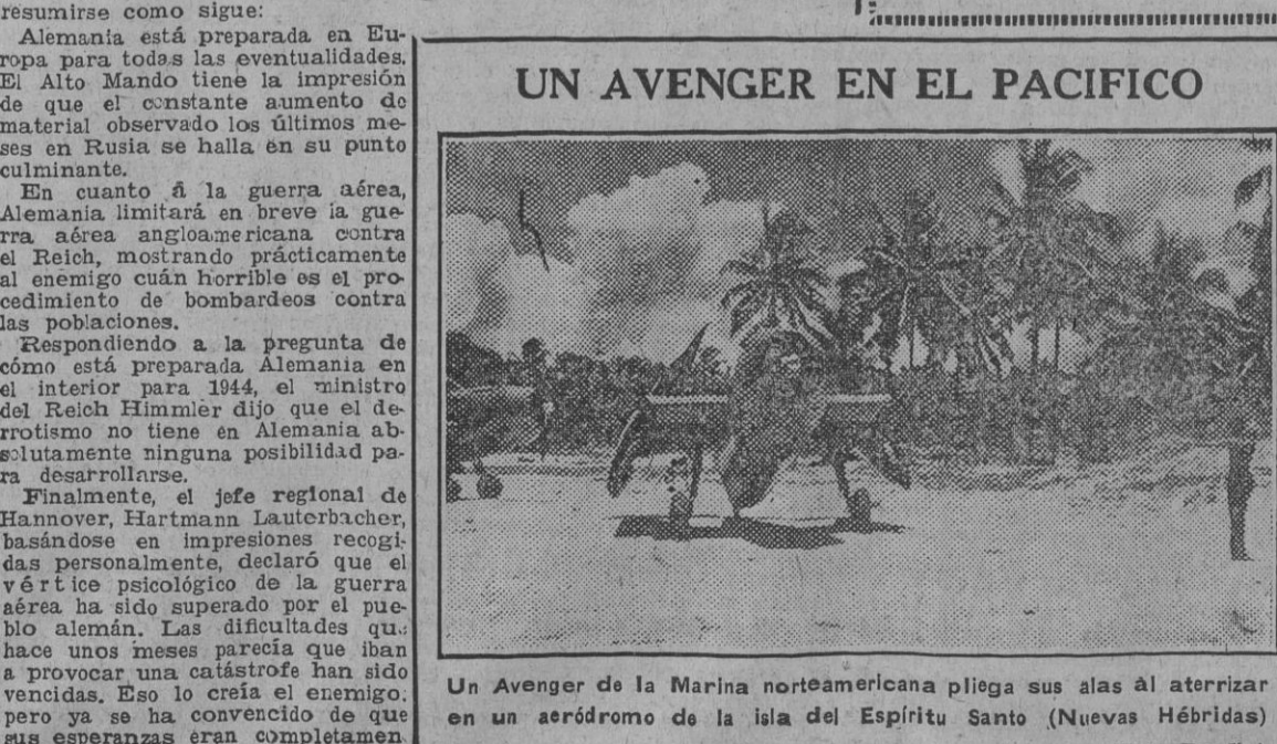
Un Avenger de la Marina norteamericana plega sus alas al aterrizar en un aeródromo de la isla del Espíritu Santo (Nuevas Hébridas).