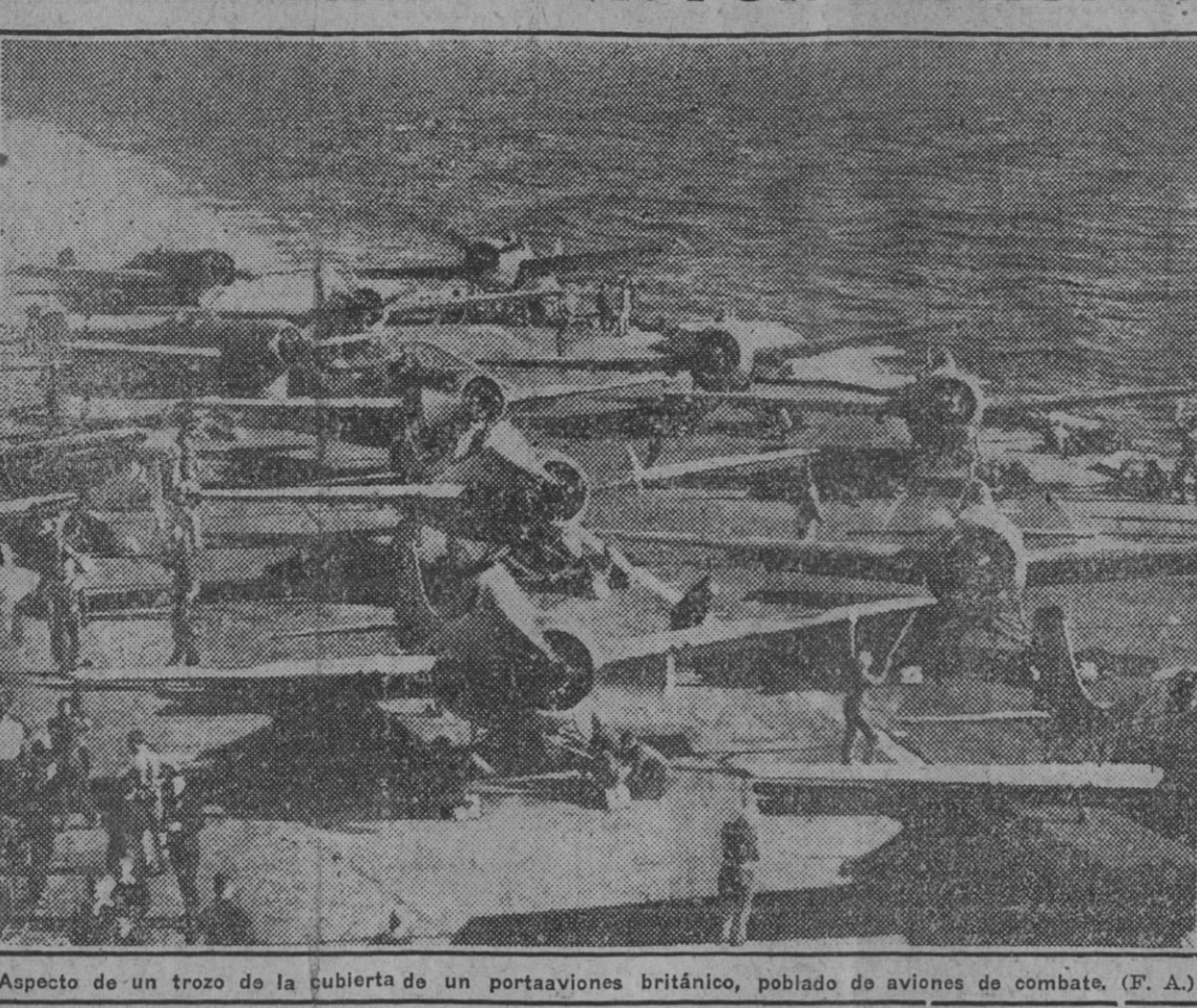
Aspecto de un trozo de la cubierta de un portaaviones británico, poblado de aviones de combate.