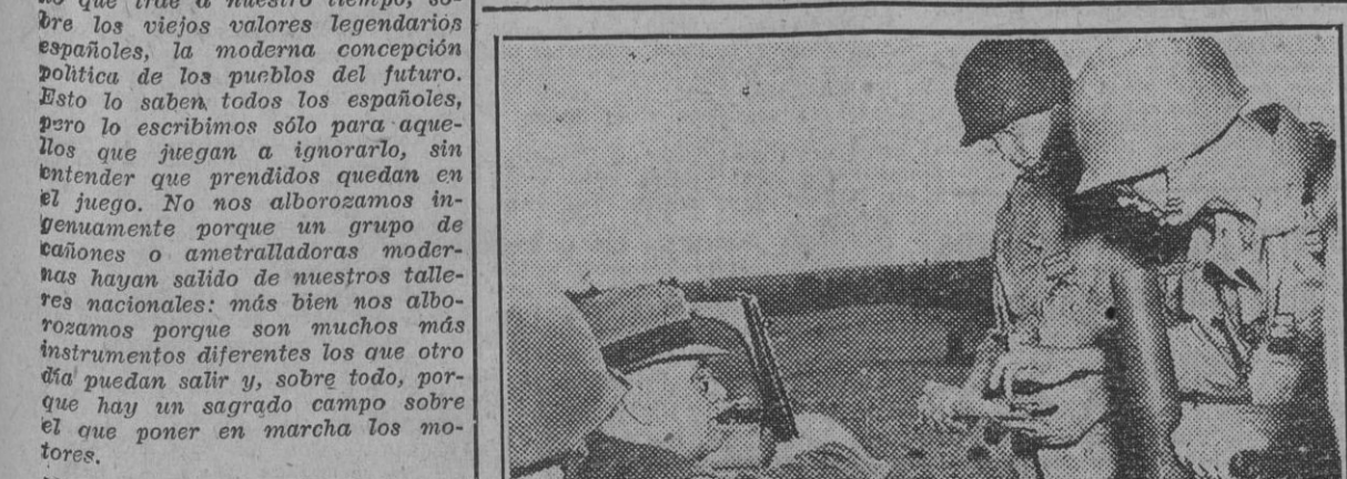
Las tropas norteamericanas cuentan desde hace poco con una nueva arma que lleva el nombre de “bazooka”. He aquí a dos especialistas explicando al Presidente Roosevelt las particularidades del proyectil.

MOSCU PIDE VIVERES Y MEDICINAS GINEBRA, 17. (S. E. T.)—“Moscu necesita urgentemente viveres. Cien millones de rússos tienen hambre. La situación de los rusos es muy grave.” Esta afirmación la hace el periódico “Neus Zuercher Zeitung” en un artículo que publica hoy.