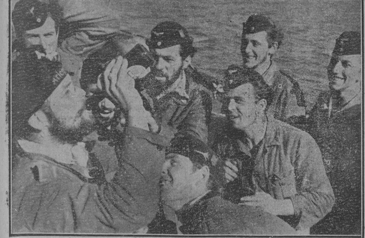
La tripulación de un submarino alemán que vuelve a la patria después de un largo crucero recibe la primera botella de cerveza, que es bebida con la natural alegría.