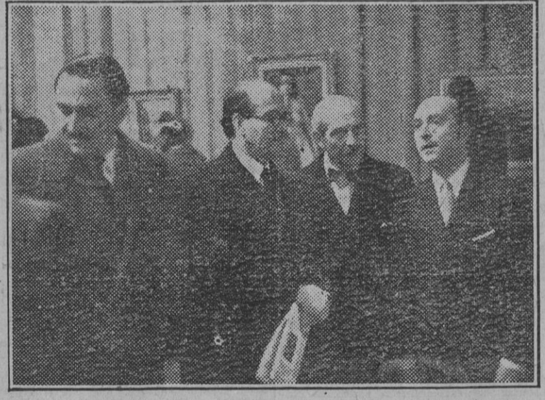
El ministro de Educación Nacional y el embajador de Francia, monsieur Pietri, con el vicepresidente de las Cortes, camarada Alfaro, en el acto inaugural de la Exposición de artistas franceses contemporáneos.