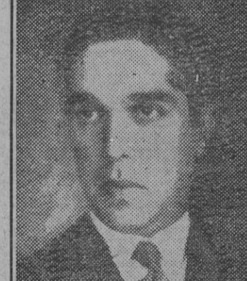
El ministro de Comunicaciones de Portugal, señor Duarte Pacheco, que ha fallecido víctima de un accidente automovilístico.