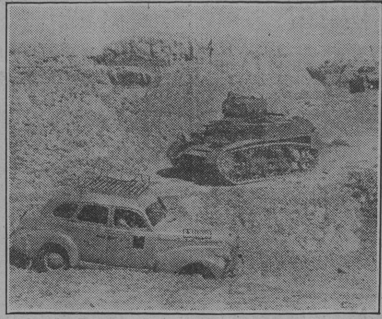
Dos carros de combate del ejército blindado indio...