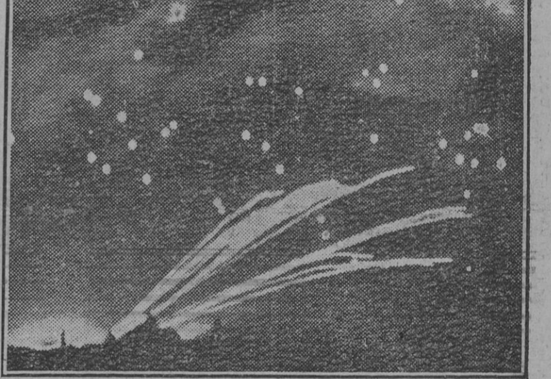
Fantástico aspecto que ofrece un ataque aéreo nocturno. El trazo de los proyectiles se dibuja perfectamente en la profunda oscuridad de la noche.