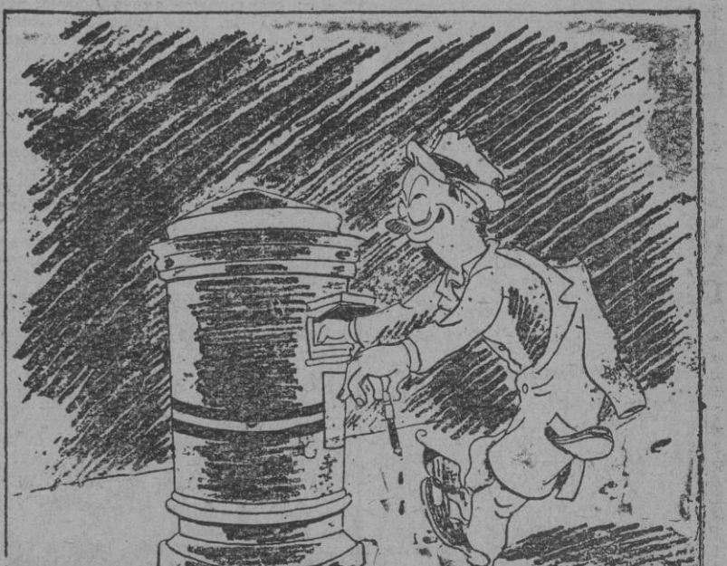
AL VOLVER, por Bellón. "Hay que ver lo que ha enanchado la cordadura de mi sasad".