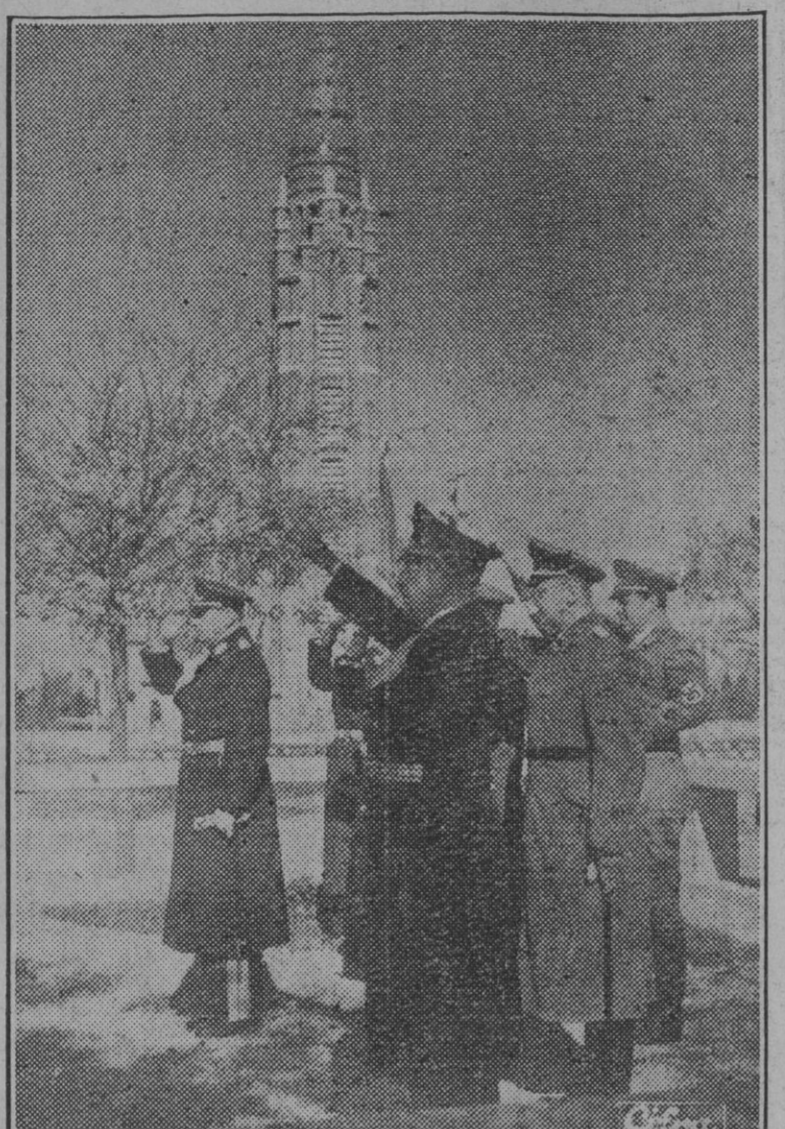
Con motivo de la conmemoración en Alemania del Día de los Caídos, los agregados militares del Reich han visitado en el cementerio de la Almudena las tumbas de los caídos de la Legión Condor, depositando en ellas coronas de laurel.