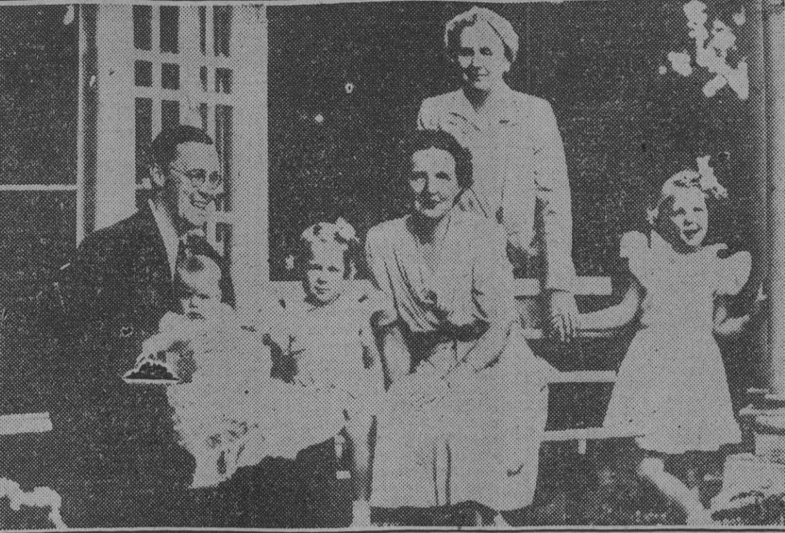
En la fotografía aparecen los miembros de la familia real holandesa en su residencia temporal, próxima a Ottawa, la capital canadiense.