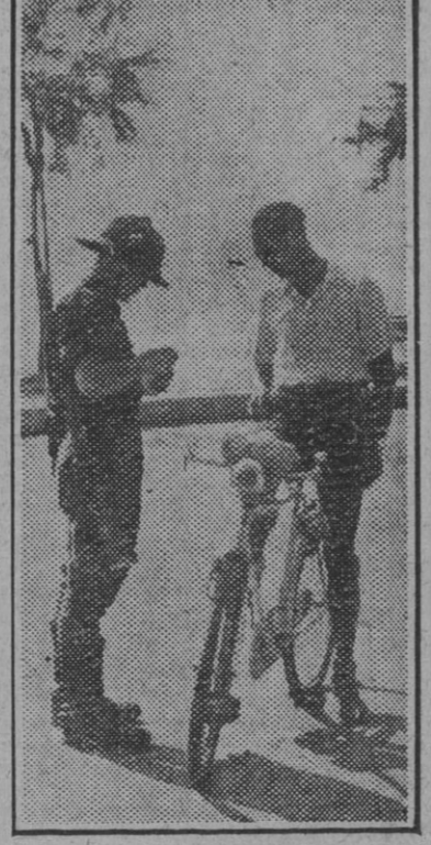
En la costa italiana un soldado alemán revisa la documentación de un soldado italiano.