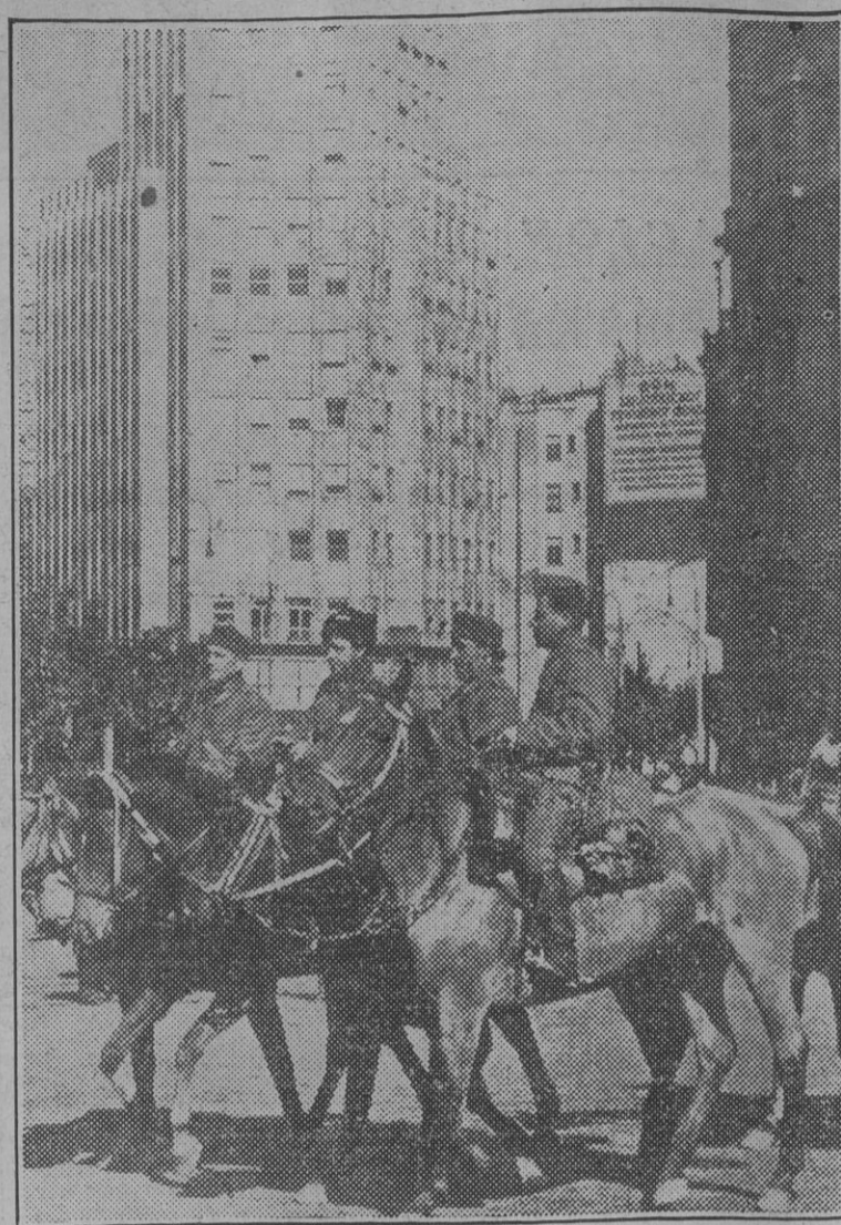
Patrullas de cosacos, incorporadas a las fuerzas alemanas, se dirigen por las calles de Belgrado al lugar designado por el Mando.