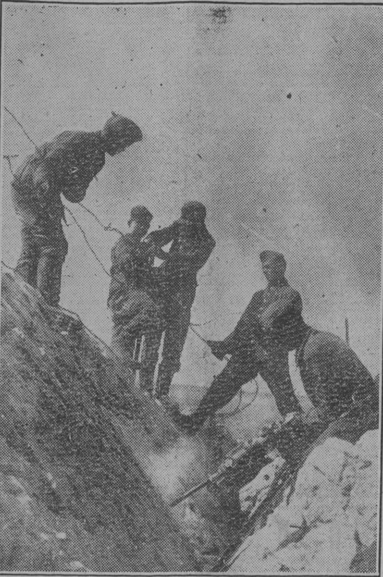
Hombres del Servicio de Trabajo del Reich haciendo hoyos en la costa mediterránea.