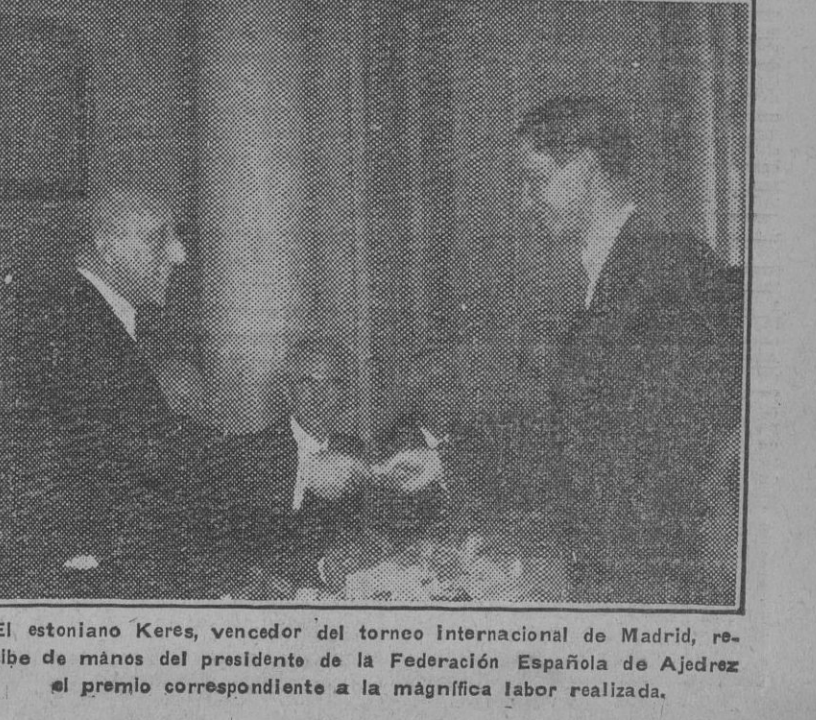
El estoniano Keres, vencedor del torneo internacional de Madrid, recibe de manos del presidente de la Federación Española de Ajedrez el premio correspondiente a la magnífica labor realizada.