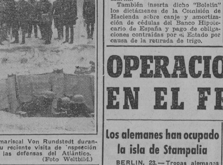
El mariscal Von Rundstedt durante su reciente visita de inspección a las defensas del Atlántico.