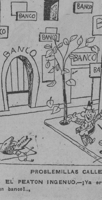
PROBLEMITAS CALLEJEROS, por Bellón. EL PEATON INGENUO.—"Ya era hora que en Madrid hubiese un banco!"