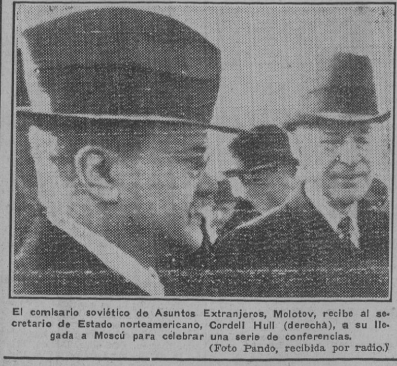
El comisario soviético de Asuntos Extranjeros, Molotov, recibe al secretario de Estado norteamericano, Cordell Hull (derecha), a su llegada a Moscú para celebrar una serie de conferencias.