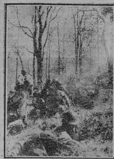
Con gran pericia actúan las tropas japonesas en el frente de China, ocasionando importantes daños al enemigo. Se distingue en estas operaciones la artillería, que aparece en la fotografía en uno de los momentos de actuación frente al adversario.