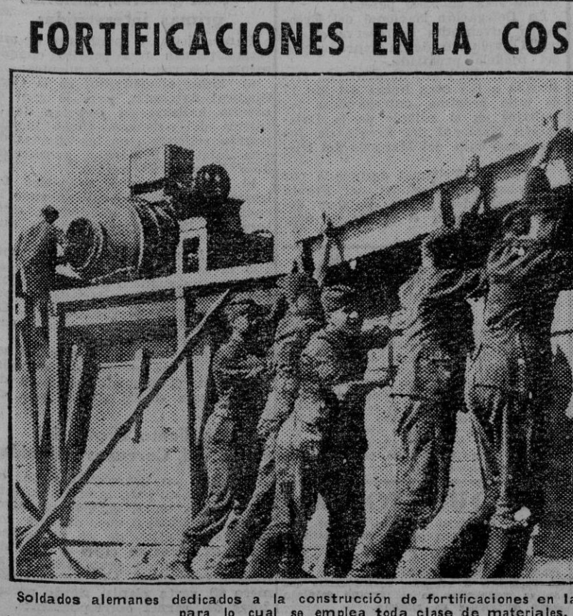
Soldados alemanes dedicados a la construcción de fortificaciones en la costa francesa del Mediterráneo, para lo cual se emplea toda clase de materiales.