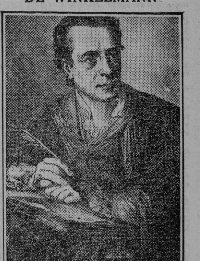
En este mes se han cumplido ciento setenta y cinco años de la muerte de Johann Joachim Winkelmann, fundador de la moderna Arqueología. Falleció en Trieste a consecuencia de las heridas sufridas en un accidente.