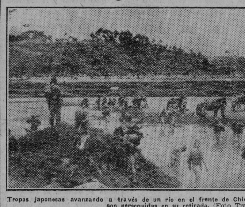
Tropas japonesas avanzando a través de un río en el frente de China. Las fuerzas de Chan-Kai-Chek son perseguidas en su retirada.