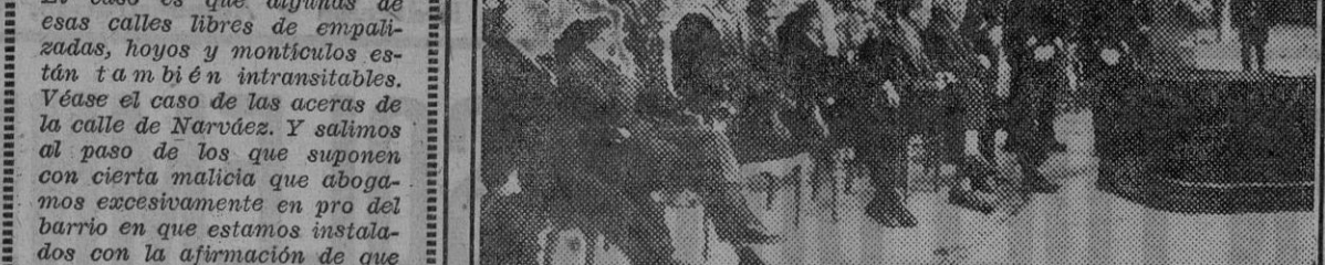
Autoridades que presidieron el acto celebrado anoche en homenaje al inmortal Miguel de Cervantes. (Foto Verdugo).

El miércoles 9, a las siete y media de la tarde, el conocido escritor camarada Agustín de Foxá, conde de Foxá, hará una lectura de su obra "Medina", en el salón de la Sección Femenina de la Falange "Medina" (San Marcos, 42).