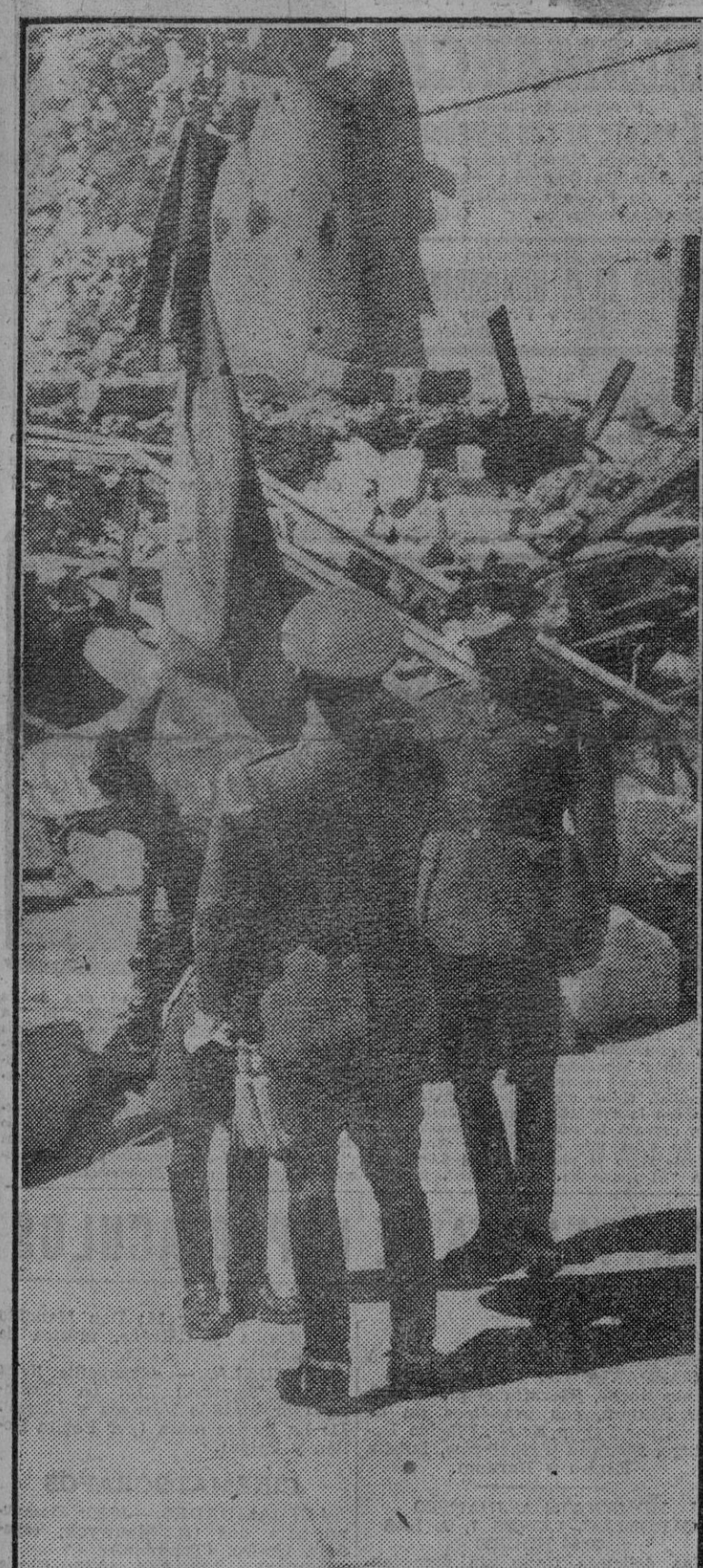
El Generalísimo jura la bandera.

Los últimos preparativos para recibir en Toledo al Jefe del Estado y Generalísimo de los Ejércitos.