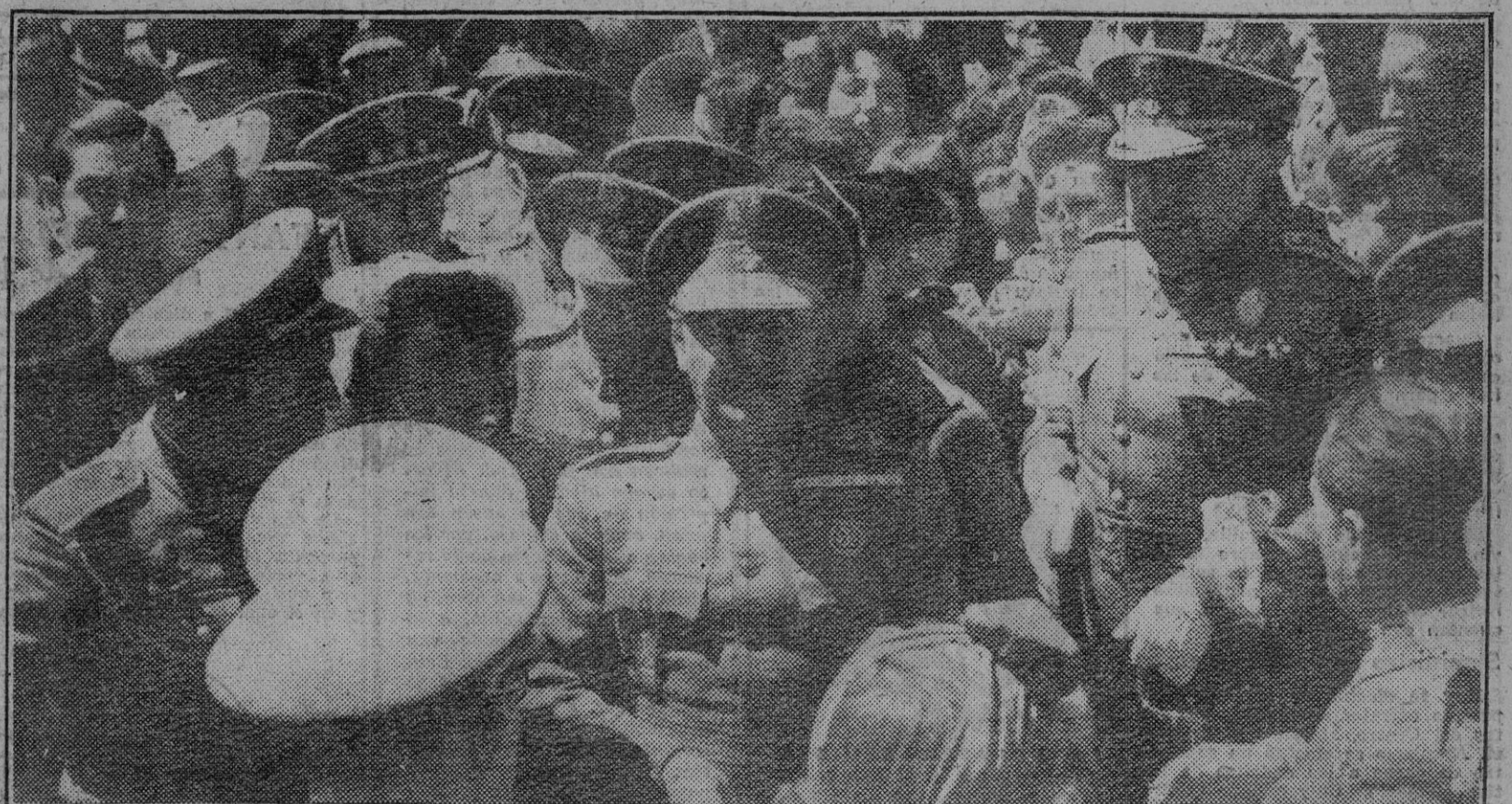
El Caudillo de España rodeado de jefes y oficiales del Ejército que lo aclamaron durante el solemne acto celebrado esta mañana en las gloriosas ruinas del Alcázar de Toledo.

Por eso este honor que a mi me otorgará la Caja Nacional de Subsidios Familiares a las familias más numerosas de toda España, y 100.000 pesetas a las familias más numerosas de cada provincia.