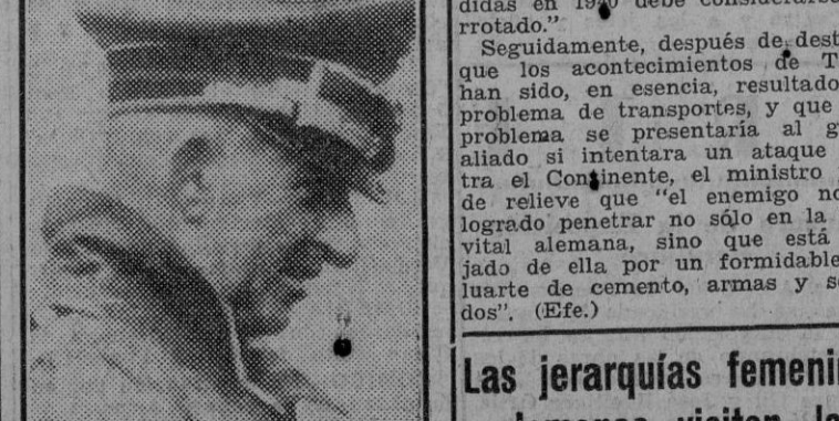
El general Von Arnim que, después de una gran campaña de defensa en África contra unidades muy superiores numéricamente, quedó prisionero de los ingleses.

La "tarjeta del artesano" es requisito indispensable para la aplicación de la "tarifa azul". Acude a encuadrarse en la Obra Sindical Artesana, José Antonio, 69, cuarto.