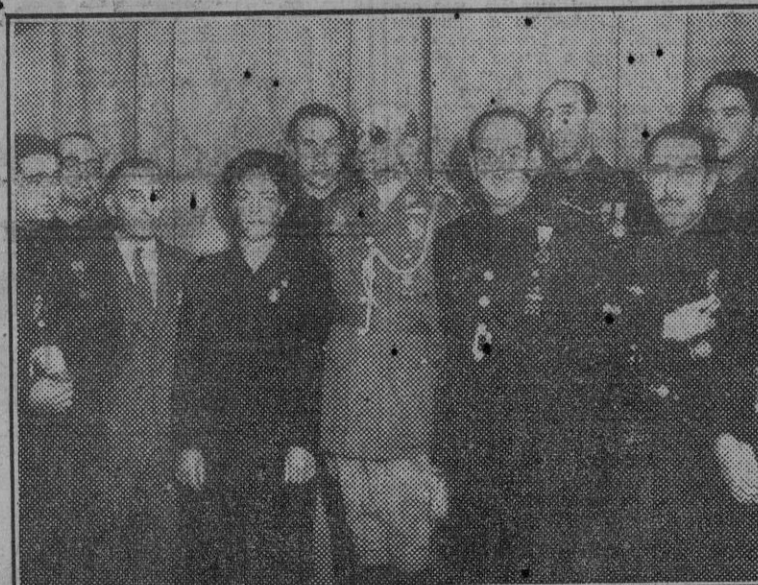
El ministro secretario general del Partido, camarada Arrese, con el glorioso defensor del Alcázar en el acto de entrega del busto que el S. E. U. ha dedicado al teniente general Moscardó.

Insistimos. No se puede lógicamente separar a los organismos sindicales de la estructura estatal, totalitaria en su esencia y en su estructura. Representan para éste una autonomía en sus funciones no peculiares, y para el individuo un cauce natural y completo que se inicia en la familia. Nuestra postura frente a la lucha de clases es bien distinta y conocida. Pero de poco valdrían los esfuerzos de los Sindicatos por organizar una estructura económica que está desbaratada si a esos medidas generales no le acompaña una reforma de tipo social. La competencia para organizar la vida económica, atribuida a los Sindicatos, no puede regredirse cuando se trata de implantar mejoras de otro tipo. Si en política tienen el marxismo, lo que predomina sobre la lucha de clases es bien distinta y conocida. Pero de poco valdrían los esfuerzos de los Sindicatos por organizar una estructura económica que está desbaratada si a esos medidas generales no le acompaña una reforma de tipo social.