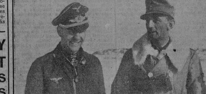
El general Dietl, heroico defensor de Narvik, aparece aquí con el oficial aviador que acaba de ser condecorado con la Cruz de Hierro.

CHURCHILL y ROOSEVELT PROSIGUEN SUS CONFERENCIAS