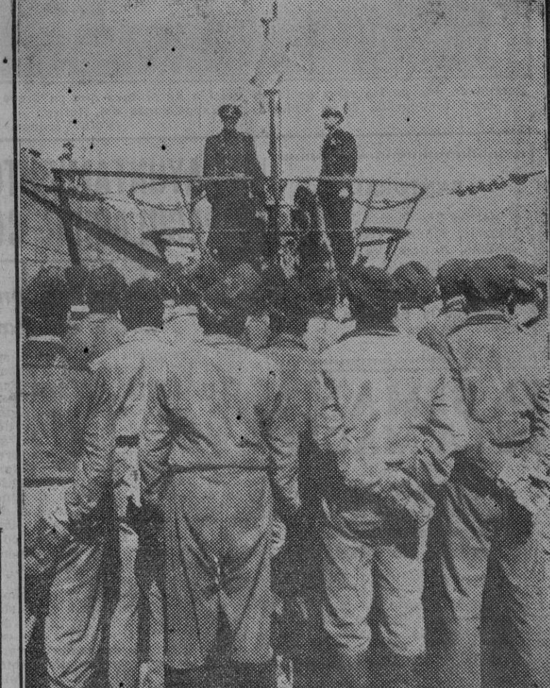
Después de una campaña por distintos mares, que consiguió el hundimiento de 46.470 toneladas, vuelve a su punto de apoyo este submarino alemán, engalanado con las grimpolas de la victoria.