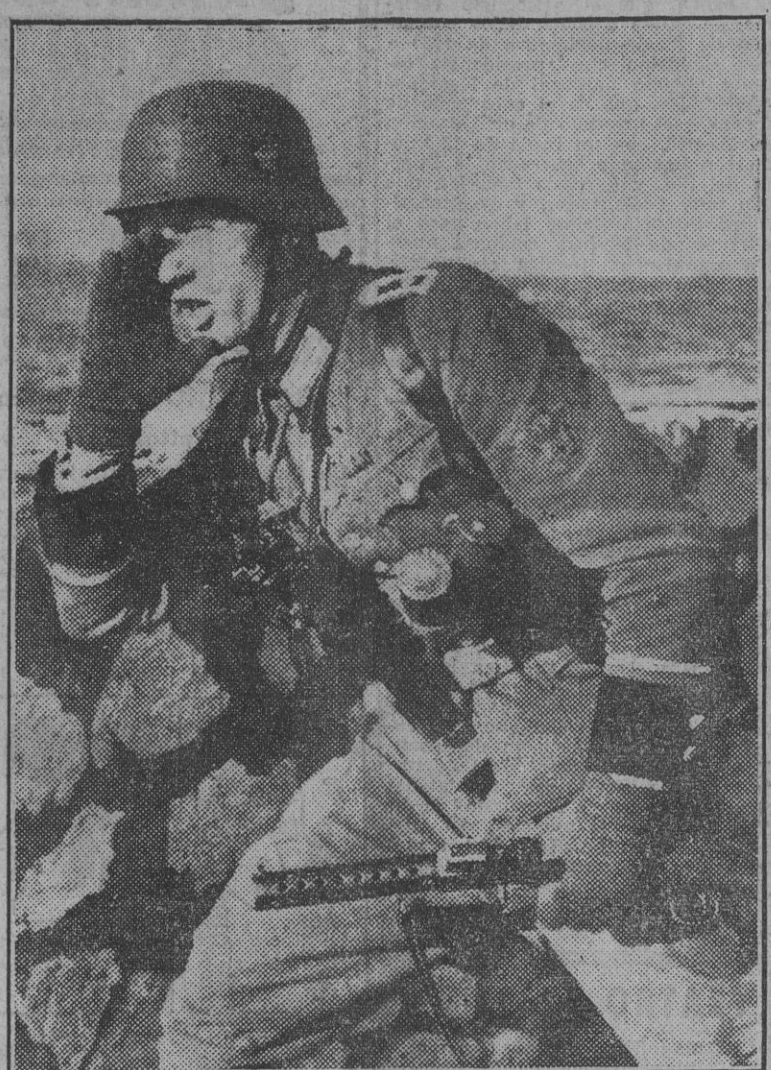
Soldados de Alemania montan guardia en Marsella y otros puntos vitales del Sur de Francia. En la foto aparece el sarago de la voz de mando para una maniobra de defensa.