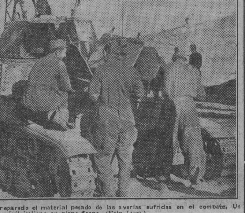
A pocos kilómetros del enemigo se reparó el material pesado de las averías sufridas en el combate. Un taller móvil italiano en plena faena.