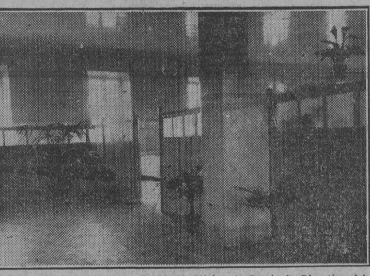
La entrada a una de las salas de la Clínica de Patología Digestiva del Hospital Provincial, que en nada difiere, como se ve, comparada con la de una clínica de lujo.