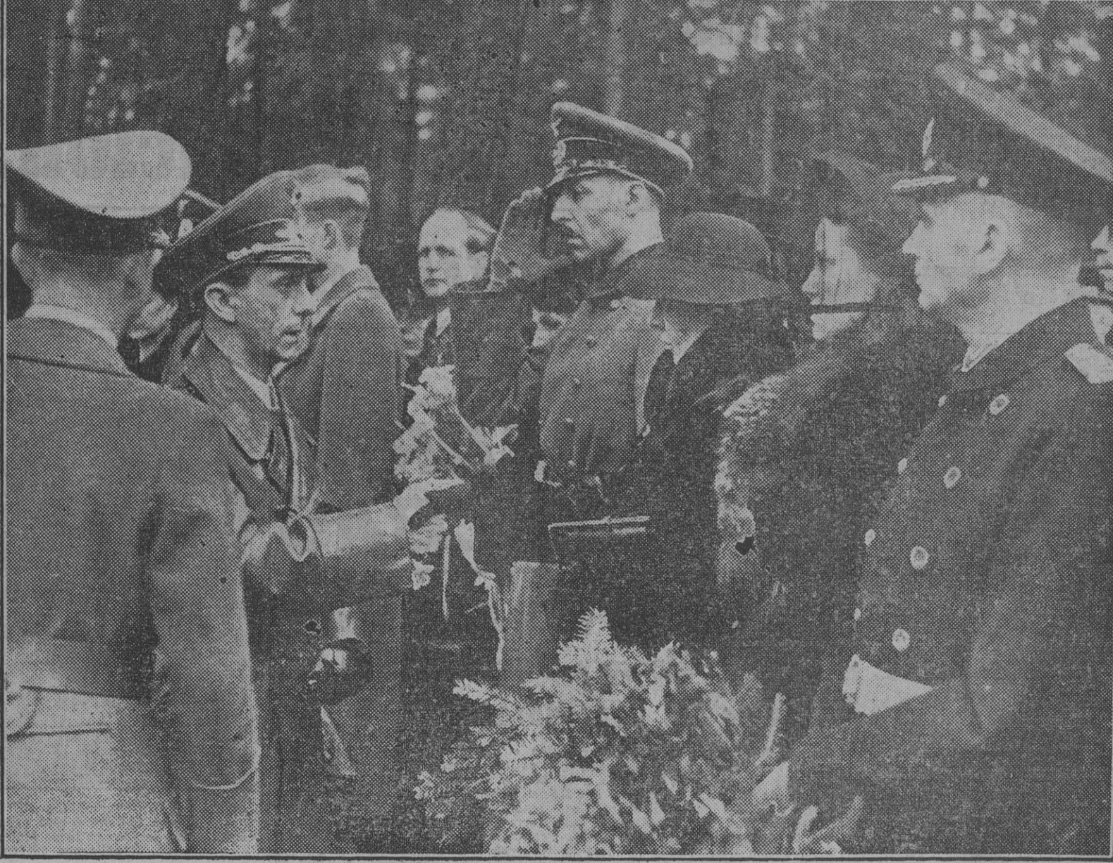
Los bombardeos aéreos contra Berlín han causado numerosas víctimas entre la población civil, así como considerables daños en los edificios públicos y privados y algunos monumentos históricos. Al acto de inhumar a los caídos asistió el doctor Goebbels, ministro de Propaganda del Reich, que aparece aquí dando el pésame a las familias de las víctimas.