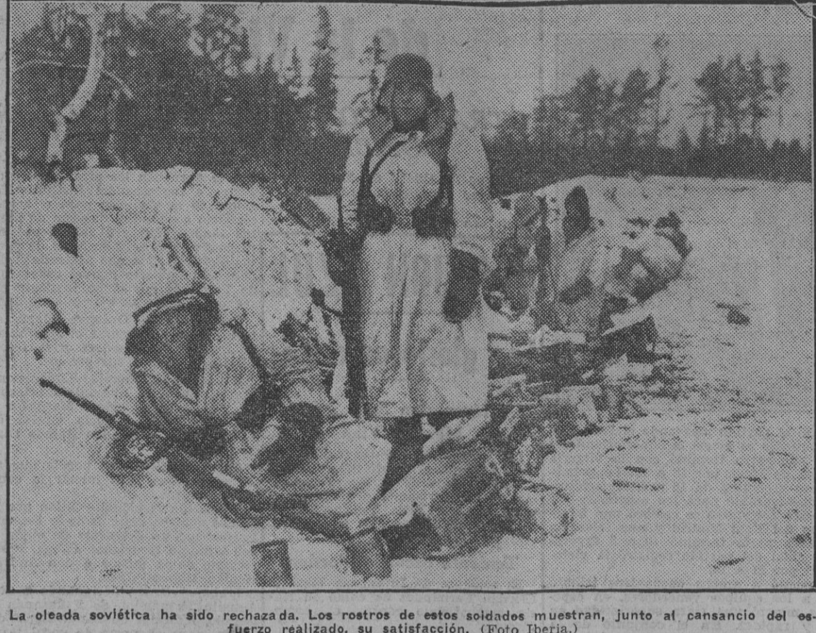
La oleada soviética ha sido rechazada. Los rostros de estos soldados muestran, junto al cansancio del esfuerzo realizado, su satisfacción.