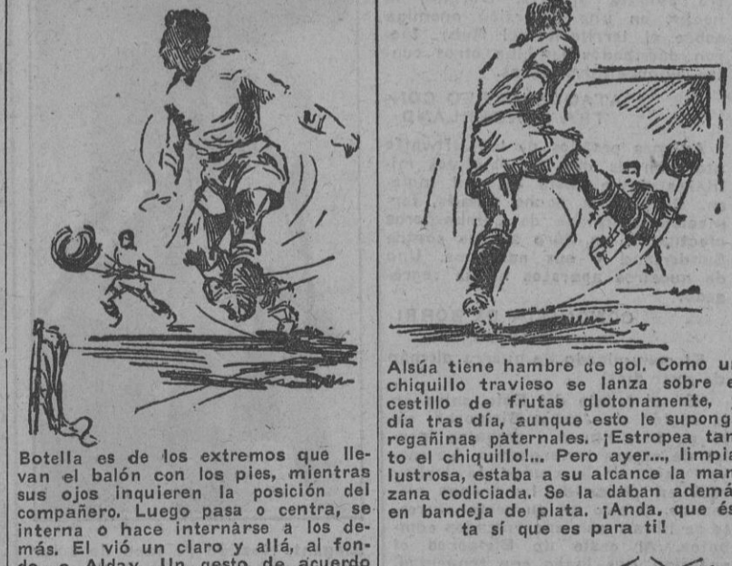
Alsúa tiene hambre de gol. Como un chiquillo travieso se lanza sobre el portero de los vascos, el madrileño, que tras días, aunque este le sponga regañinas paternales, ¡Estropea todo el chiquillo!.