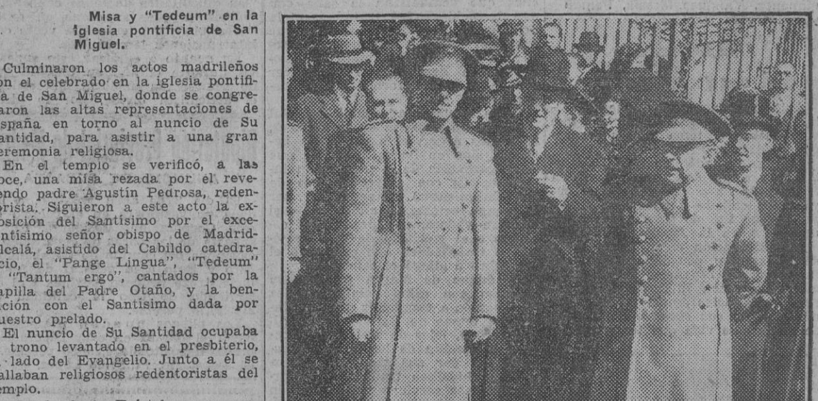
Los ministros del Ejército, Asuntos Exteriores y Justicia, a la salida del Teódeum celebrado ayer con ocasión del Día del Papa.

Ayer, con fervor y brillantez extraordinarios, fué conmemorado en toda España el IV aniversario de la coronación de Su Santidad Pío XII, que coincide con el Año Jubilar, que será clausurado en el próximo mes de mayo. En todas las parroquias e iglesias de las diócesis se celebraron comuniones generales por las intenciones del Pontífice. Revisió el Día del Papa gran solemnidad, tanto en Madrid como en provincias.