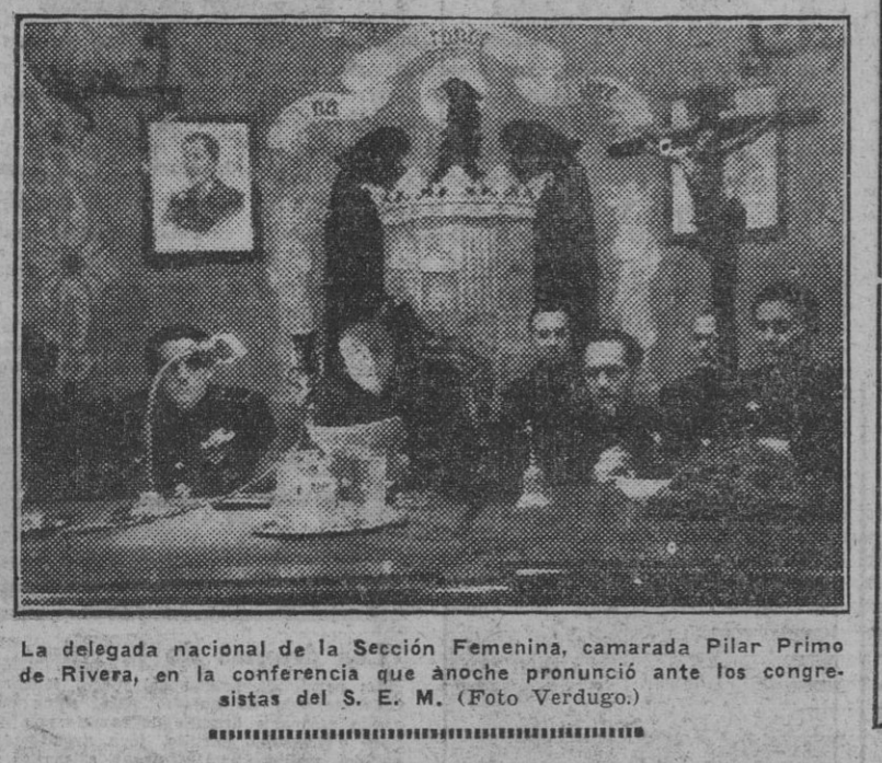
La delegada nacional de la Sección Femenina, camarada Pilar Primo de Rivera, en la conferencia que anoche pronunció ante los congresistas del S. E. M.

EL CAMARADA ARRESE, EN LA BASILICA DE NUESTRA SEÑORA DE LAS ANGIUSTIAS... Inmediatamente se dirigió a la Basílica de Nuestra Señora de las Angustias, enclavada en la Carretera del Genil, donde se hallaban esperando al ministro todos sus autoridades y camaradas del Movimiento, una centuria del Frente de Juventudes, dos compañías de la Milicia Universitaria, una nutrida representación de la Sección Femenina, camaradas de la Vieja Guardia, numerosos afiliados al Partido y la Banda Municipal.