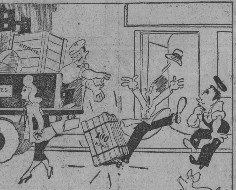
LA MANIA CHISTOFILA DEL DIA, Una magnífica ocasión para no preguntar lo que le dijo.

VICHY, 4.—A la salida del Consejo de ministros celebrado esta mañana a las 10.30 horas se ha facilitado el siguiente comunicado: "El jefe del Gobierno ha pedido un informe sobre el estado en que se encuentran los buques hundidos en Tolón y las posibilidades que hay de poder utilizarlos ulteriormente. El Consejo examinó a continuación los asuntos relacionados con la desmovilización del Ejército y la Marina. El ministro de Producción Industrial y Comunicaciones ha quedado en el cargo de redactar un proyecto de ley sobre la incorporación en la industria y en el comercio de gran número de oficiales, medida que se realizará sólo en condiciones especiales. El general Delattre de Tassigny será juzgado por el Tribunal de Estado." (Efe).