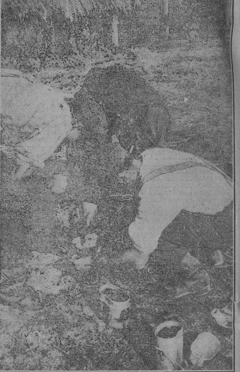
En Rusia los soldados alemanes apuran hasta la última gota de café en sus vasos de campaña.