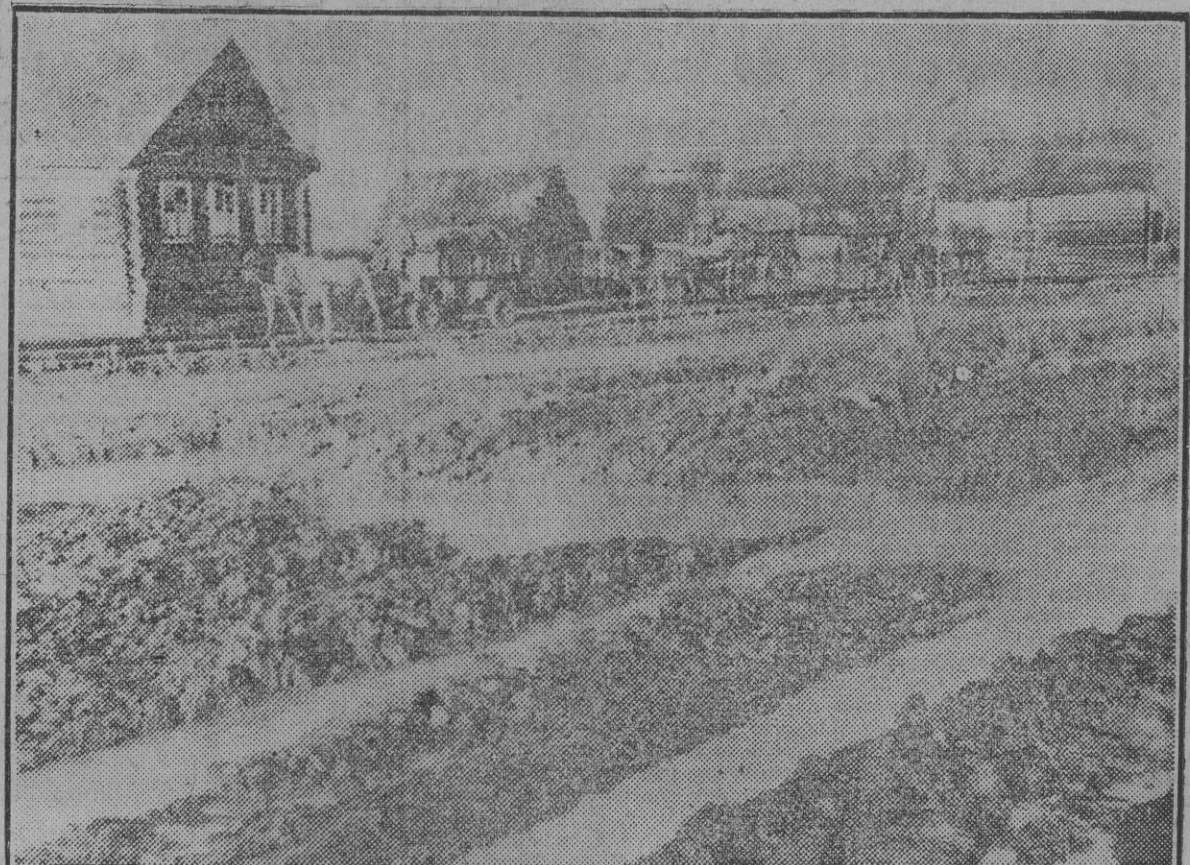
Este es el estado en que se encuentran las carreteras y los caminos de Rusia por efecto de las lluvias del otoño, que muy pronto irán seguidas—en algunos frentes lo han sido ya—por el hielo y las tempestades de nieve. A través de estas tierras, convertidas en ciénagas y lodazales, prosigue metódicamente el avance alemán.