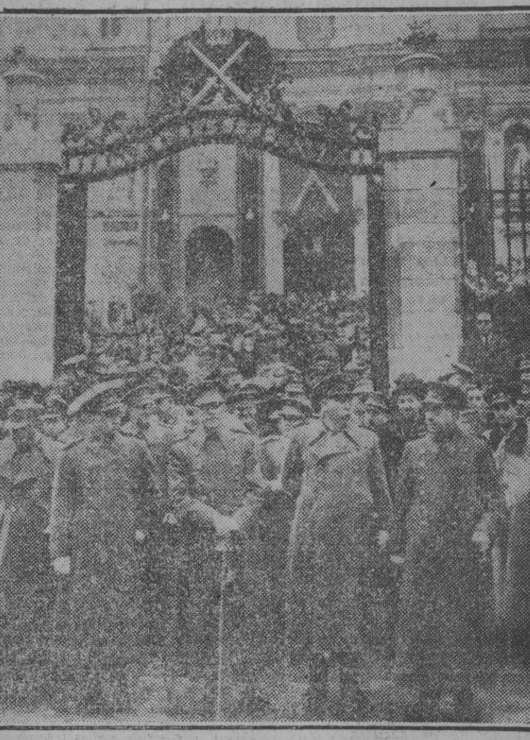
Los ministros del Ejército y del Aire, el general Saliquet y otros altos jefes del Ejército a la salida de la misa celebrada esta mañana en la iglesia de Santa Bárbara con motivo de la festividad de la Patrona del Arma de Artillería.