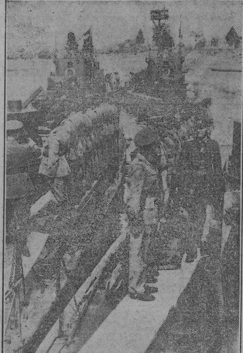
Un general alemán pasa revista a una flotilla húngara que presta servicio en el Danubio.