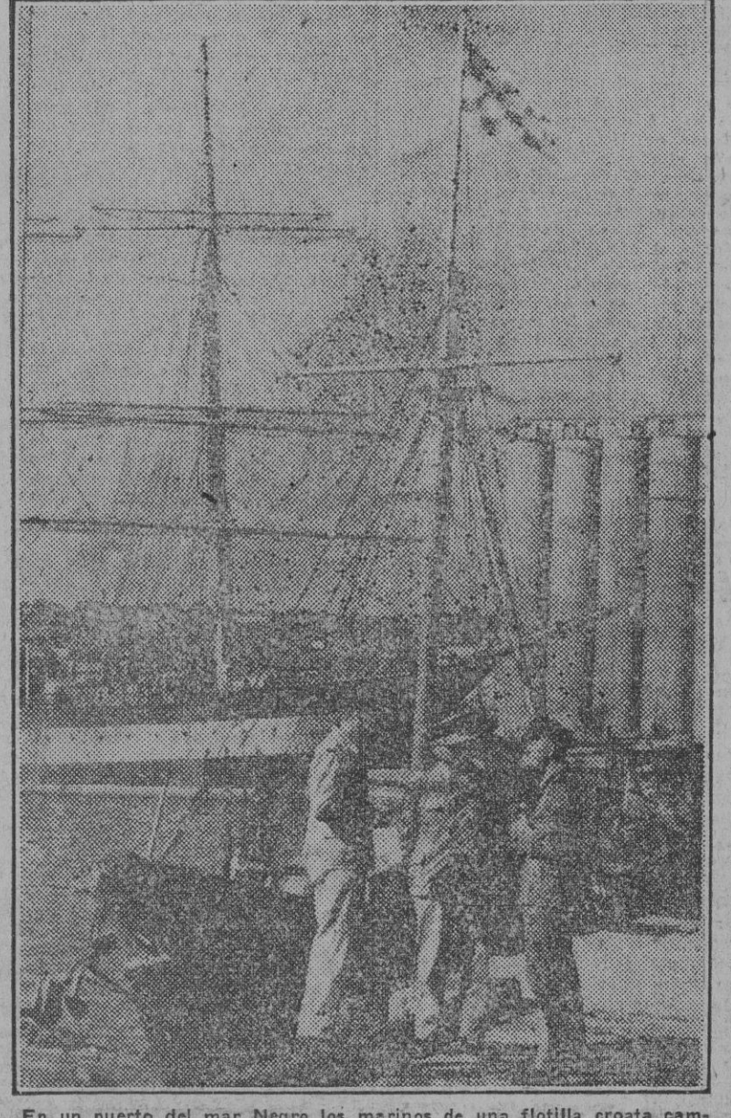
En un puerto del mar Negro los marineros de una flotilla croata cambian impresiones.