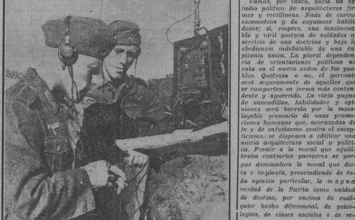
Los telegrafistas alemanes mantienen la comunicación entre la trinchera más avanzada y las baterías.