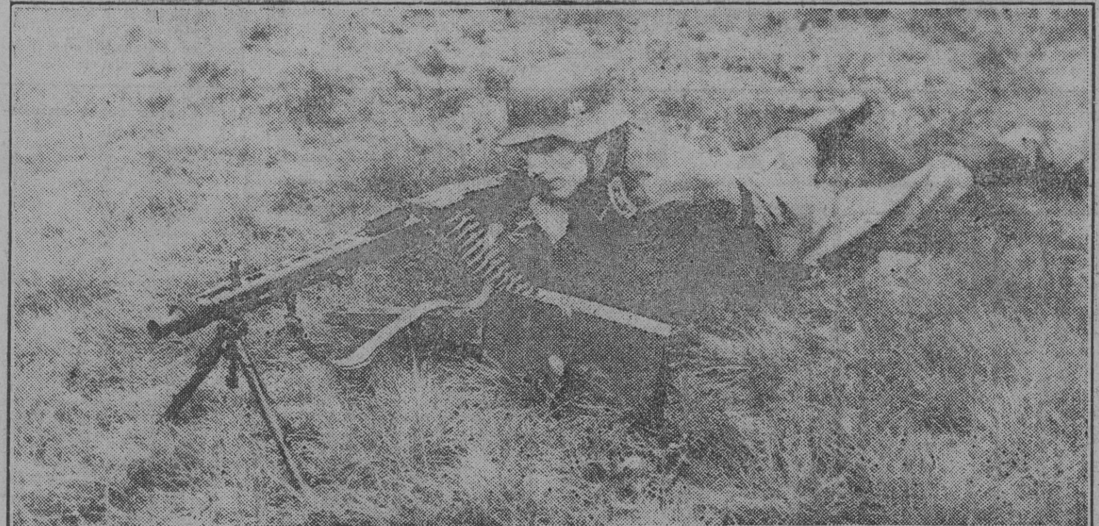
Esta es una de las nuevas armas alemanas que está ametralladora extraordinaria, que dispara a la fantástica velocidad de 3.000 proyectiles por minuto, esto es, 50 balas por segundo. Empleada ya en Stalingrado, su formidable potencia de fuego ha causado pérdidas elevadísimas a los bolcheviques.

Ataque de la Aviación inglesa contra una población de Indochina