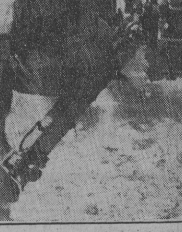
A 4.320 metros de altitud, en las proximidades nevadas del Elbrus, está emplazada esta pieza de artillería alemana, la más "alpina" de la guerra. Dos de sus sirvientes se tapan los oídos después de lanzar un disparo sobre las líneas bolcheviques.