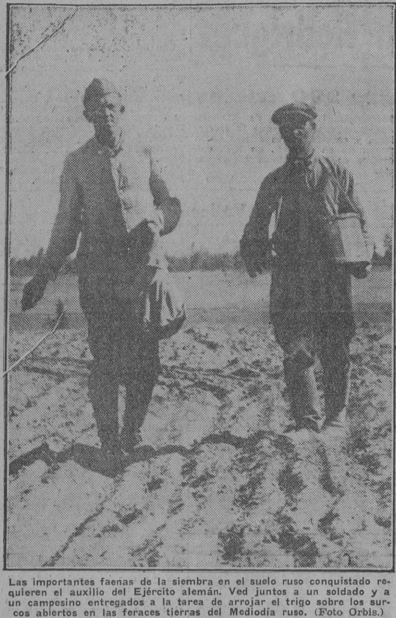
Las importantes faenas de la siembra en el suelo ruso conquistado requieren el auxilio del Ejército alemán. Ved juntos a un soldado y a un campesino entregados a la tarea de arrear el arado sobre los surcos abiertos en las férciles tierras del Mediodía ruso.