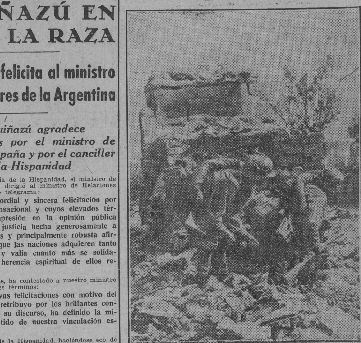
Luchando "entre escombros" y por los escombros, estos soldados alemanes preparan la voladura de una posición enemiga.