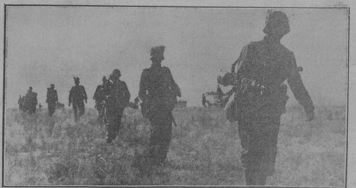
Las operaciones ofensivas del Ejército alemán prosiguen sin interrupción en el frente meridional de Rusia. Estos soldados de infantería se disponen a tomar nuevas posiciones a vanguardia, avanzando en fila de uno a través de los campos desiertos. Obsérvese cómo la naturaleza del terreno les obliga a camuflarse con ramaje sobre el casco.