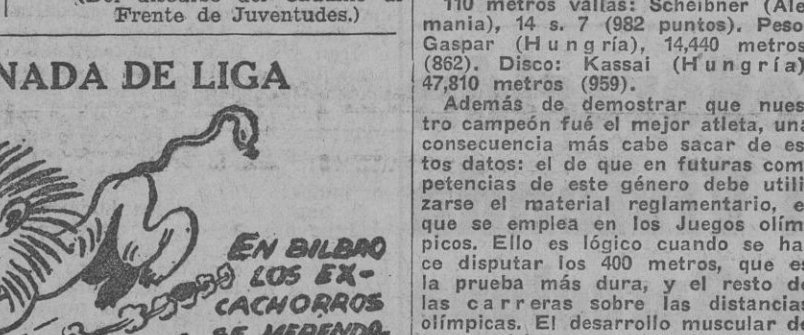
Los resultados de San Mamés, Las Corts y Mestalla, vistos por el dibujante deportivo de "Unidad", de San Sebastián.