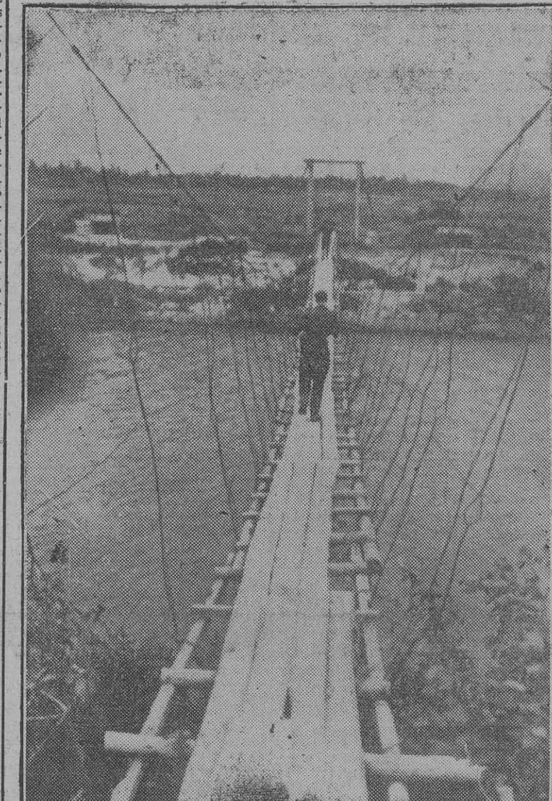
Después de sus últimas operaciones victoriosas contra las fuerzas soviéticas, los soldados alemanes han construido este puente colgante de madera para asegurar la comunicación entre las dos orillas del lago Ilmen.