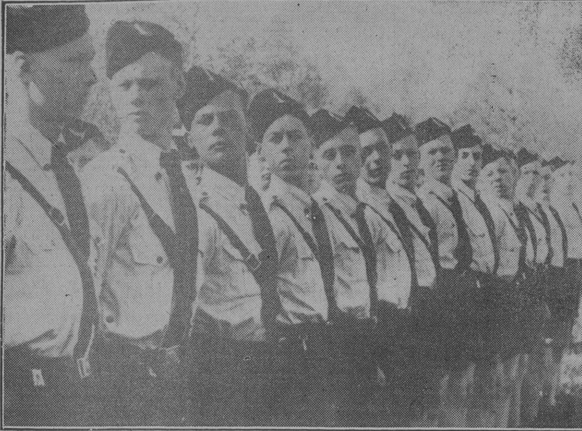
Los futuros legionarios holandeses se preparan para la lucha por la nueva Europa.

La fundación de la Unión de Juventudes Europeas en Viena