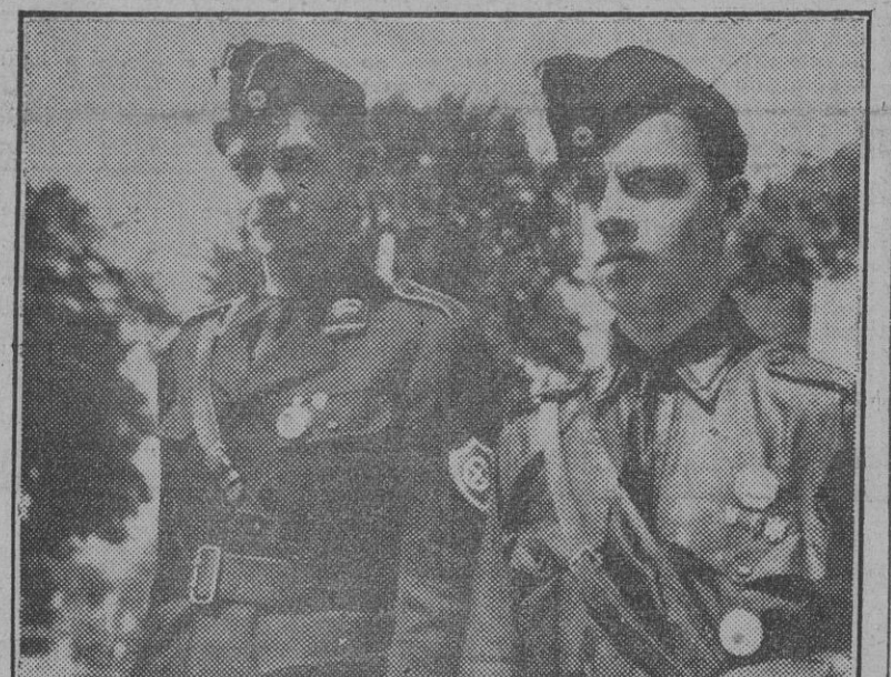
La juventud belga responde al llamamiento de Degrelle.