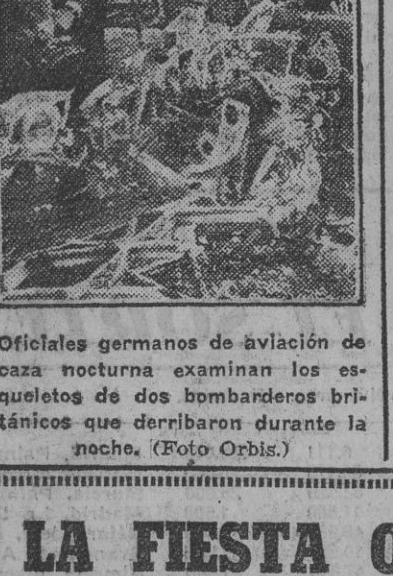
Desastre inglés. Oficiales germanos de aviación de caza nocturna examinan los escombros de dos bombarderos británicos que derribaron durante la noche.

Más de 28.000 muertos y 12.370 prisioneros soviéticos Duros combates en el Cáucaso EN STALINGRADO FUERON ALCANZADOS TODOS LOS OBJETIVOS PROPUESTOS