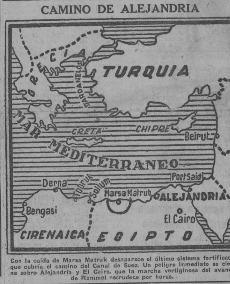
Con la caída de Marsa Matruh desaparece el último sistema fortificado que cubría el camino del Canal de Suez. Un peligro inmediato se cierne sobre Alejandría y El Cairo, que la marcha vertiginosa del avance de Rommel recorre por horas.

TUNIZ, 29.—El Rey Faruk, según comunican en Casablanca, ha confabulado al presidente del Consejo, Nahas Pashá. (Efe.)