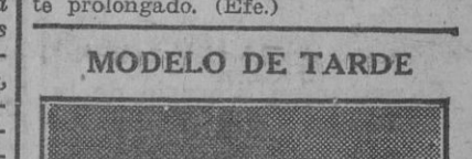
Un acabado modelo de vestido de tarde en blanco y negro.