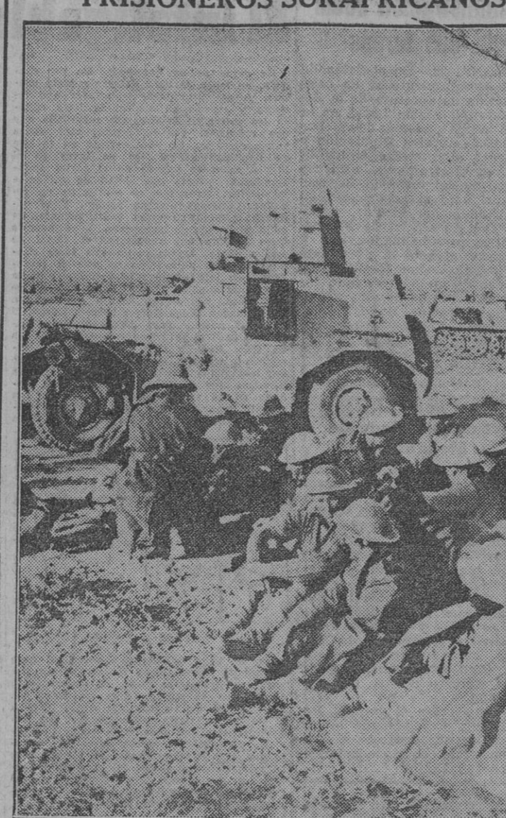
Soldados ingleses y surafricanos capturados en el Acroma durante la batalla en que las fuerzas blindadas del general Ritchie fueron ampliamente batidas por el mariscal Rommel.