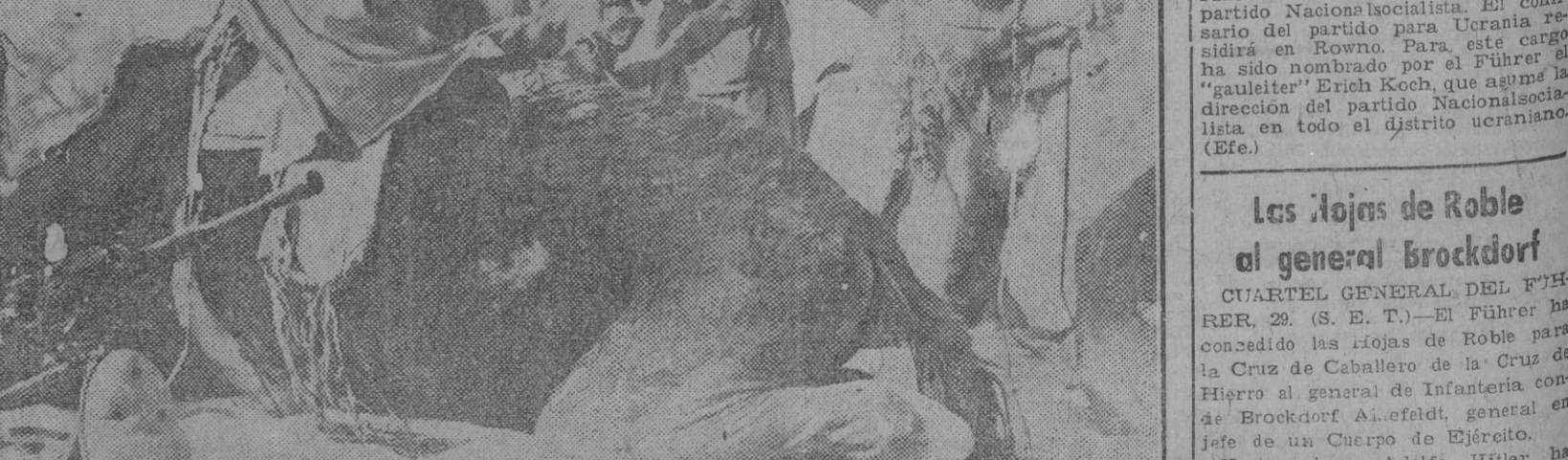
El sistema de fortificaciones de Sebastopol, sobre todo en las líneas avanzadas. Estas minas de las trincheras son voladas mediante una instalación eléctrica, que sólo conoce cada comisario político del sector correspondiente. Con estas trincheras minadas el enemigo persigue un fin. Obliga a sus propios soldados resistir hasta el último momento bajo la amenaza de hacer volar las minas, y puede volarlas también cuando las tropas enemigas quieren ocupar las trincheras, incluso sin que se puedan salvar los defensores soviéticos. (Efe.)

Meharistas italianos que completan los servicios de aprovisionamiento realizados por elementos de tracción mecánica. (Foto A. P.)