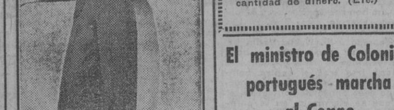
Combinación deportiva a base de pantalón verde oscuro con peto y tirantes y blusa de seda a cuadros.