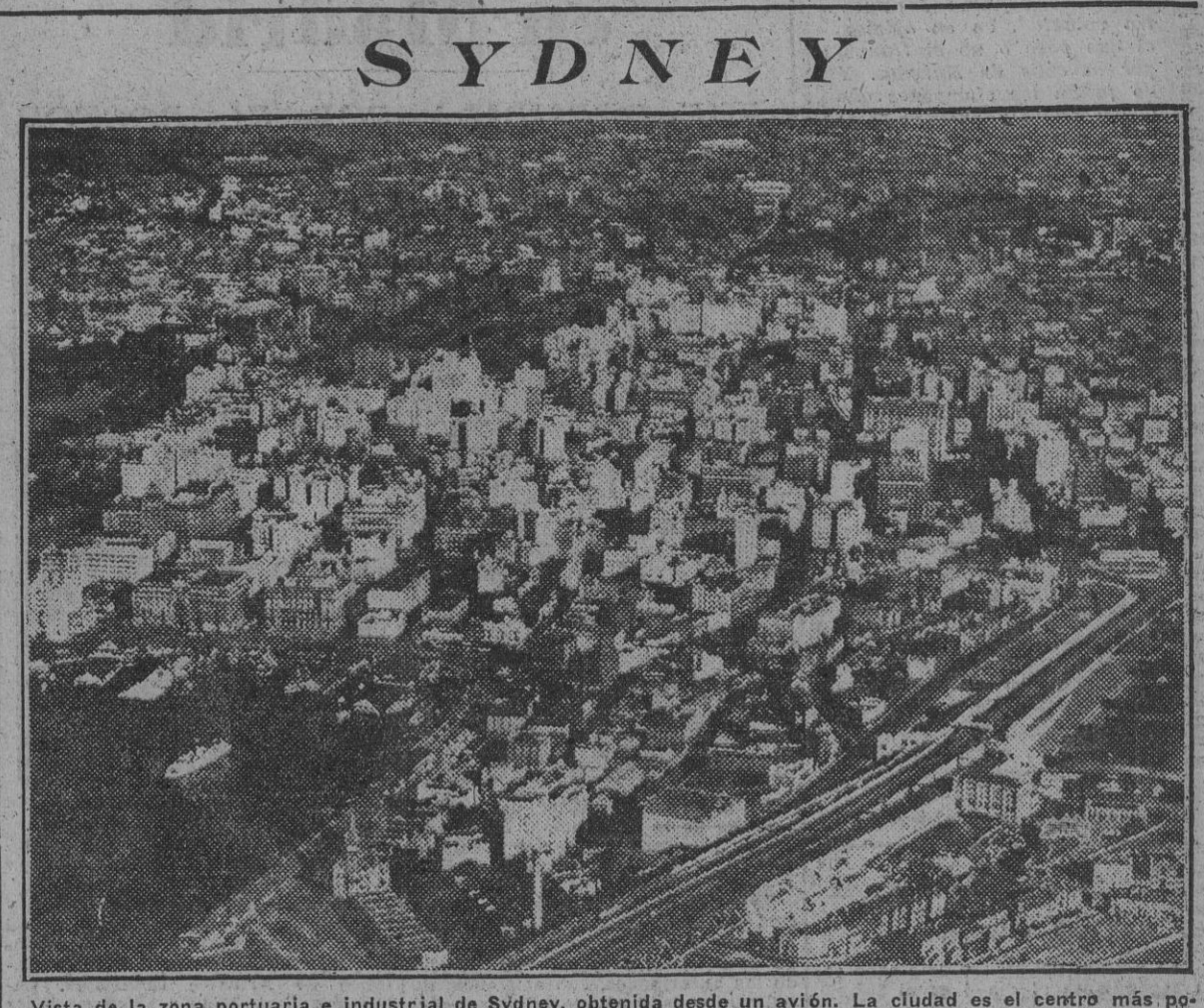
Vista de la zona portuaria e industrial de Sydney, obtenida desde un avión. La ciudad es el centro más populoso y el puerto más activo del Continente australiano. Es también el primer puerto de Australia que ha conocido el primer ataque japonés, llevado a cabo con submarinos de pequeño radio de acción.

TOKIO, 5.—El comunicado imperial anuncia que el 31 de mayo los submarinos japoneses atacaron la base naval Diego Suárez y averiaron el acorazado del tipo "Queen Elizabeth" y el crucero del tipo "Arethusa". (Efe.)