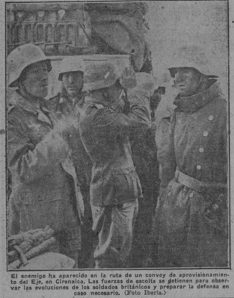
El enemigo ha aparecido en la ruta de un convoy de aprovisionamiento del Eje, en Cirenaica. Las fuerzas de escolta se detienen para observar las evoluciones de los soldados británicos y preparar la defensa en caso necesario.