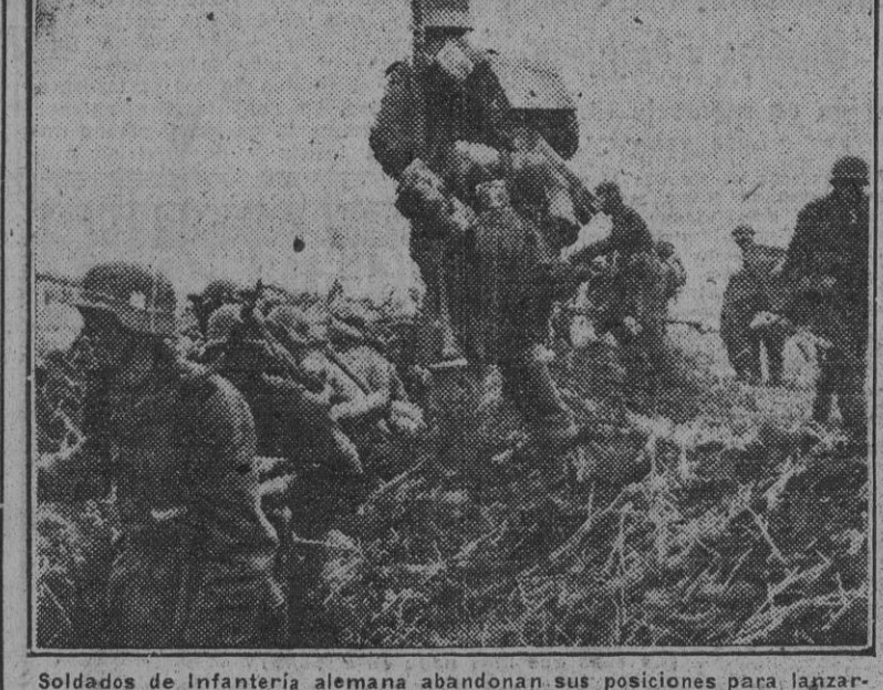
Soldados de infantería alemana abandonan sus posiciones para lanzarse al asalto de las trincheras enemigas en un sector de Jarkov.