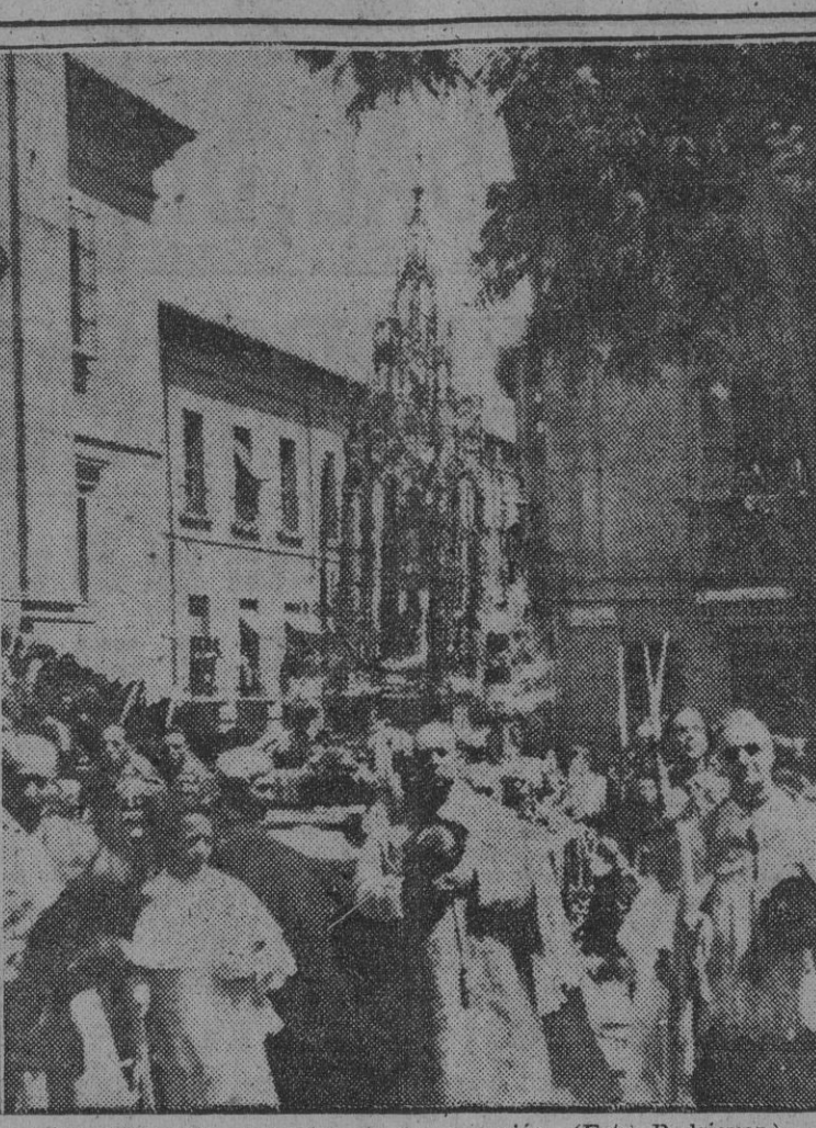
TOLEDO.—Un momento de la procesion.

El profesor susco Seeborg, de fama científica internacional, ha inventado un método para la obtención sintética del caucho, partiendo de los residuos de la fabricación del alcohol. Con el material obtenido como resultado de los primeros ensayos se han confeccionado las botas que el inventor muestra en la foto.