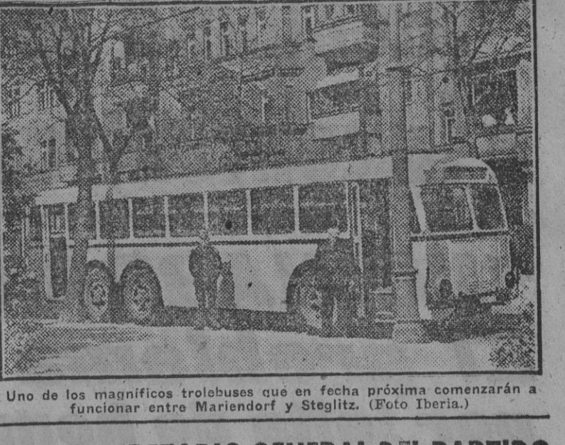
Uno de los magnificos trolebuses que en fecha próxima comenzarán a funcionar entre Mariendorf y Steglitz.