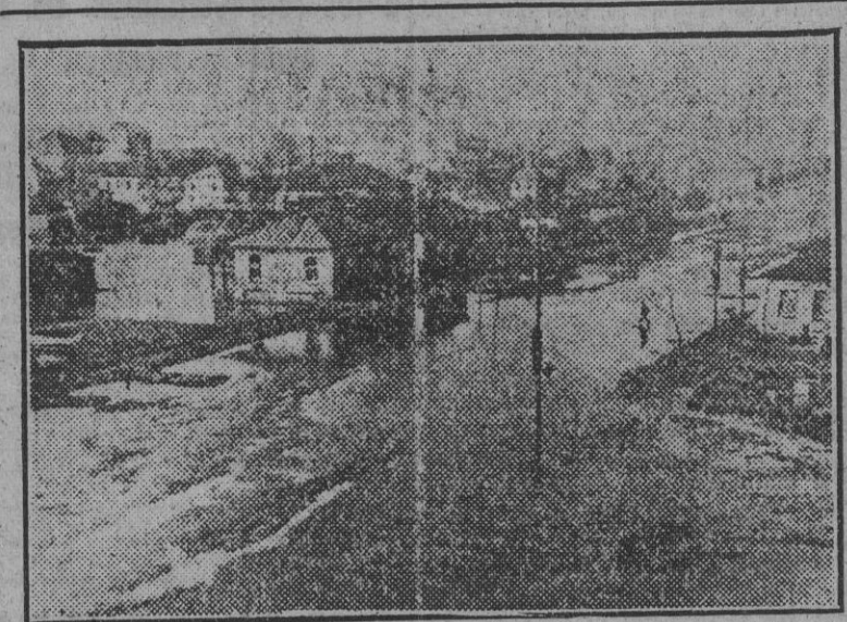
Aspecto de una aldea rusa completamente inundada por el deshielo. Las autoridades alemanas de ocupación han adoptado las medidas necesarias para salvaguardar la parte edificada, previa evacuación de sus habitantes.