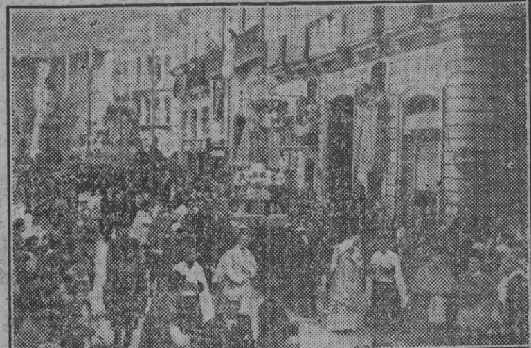
El paso de la Virgen de los Desamparados por las calles de la capital levantina es presenciado por los fieles con gran fervor religioso.