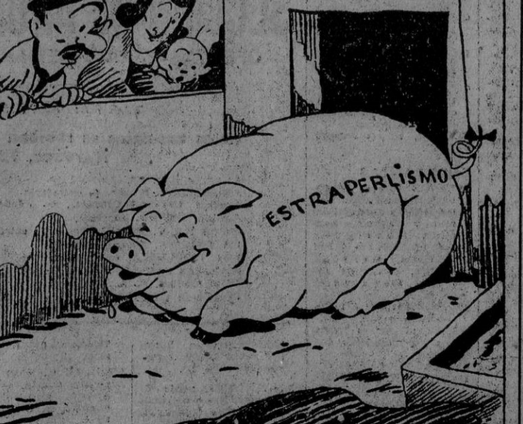
WUCHO ENGORDA, PERO... por Bellón —Si, chica, ¡le tiene que llegar su San Martín!

CUARTEL GENERAL DEL FUHRER, 9.—Comunicado del Alto Mando de las fuerzas armadas alemanas: "En los sectores central y septentrional del frente del Este han sido rechazados fuertes ataques locales del enemigo. En el Golfo de Finlandia han fracasado también varios intentos efectuados por las tropas soviéticas contra la isla de Tytaasaari, ocupada por fuerzas alemanas y finlandesas. El envío de 270 muertos sobre el campo de batalla. En la costa del Cáucaso los aviones alemanes han bombardeado eficazmente varias ciudades del litoral de Alemania Septentrional. Cuatro aparatos enemigos han sido derribados. Aviones ingleses aliados han efectuado vuelos de hostigamiento sobre el Sur y Este de Alemania." (Efe.)