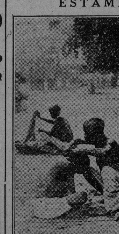
Peliquero ambulante hindú presta sus servicios en una calle de Nueva Delhi.