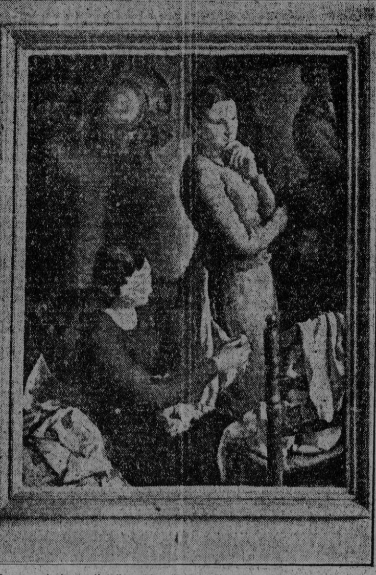
"En casa de la modista", cuadro de Antonio Vila que figura en la Exposición de Arte Español en Berlín.