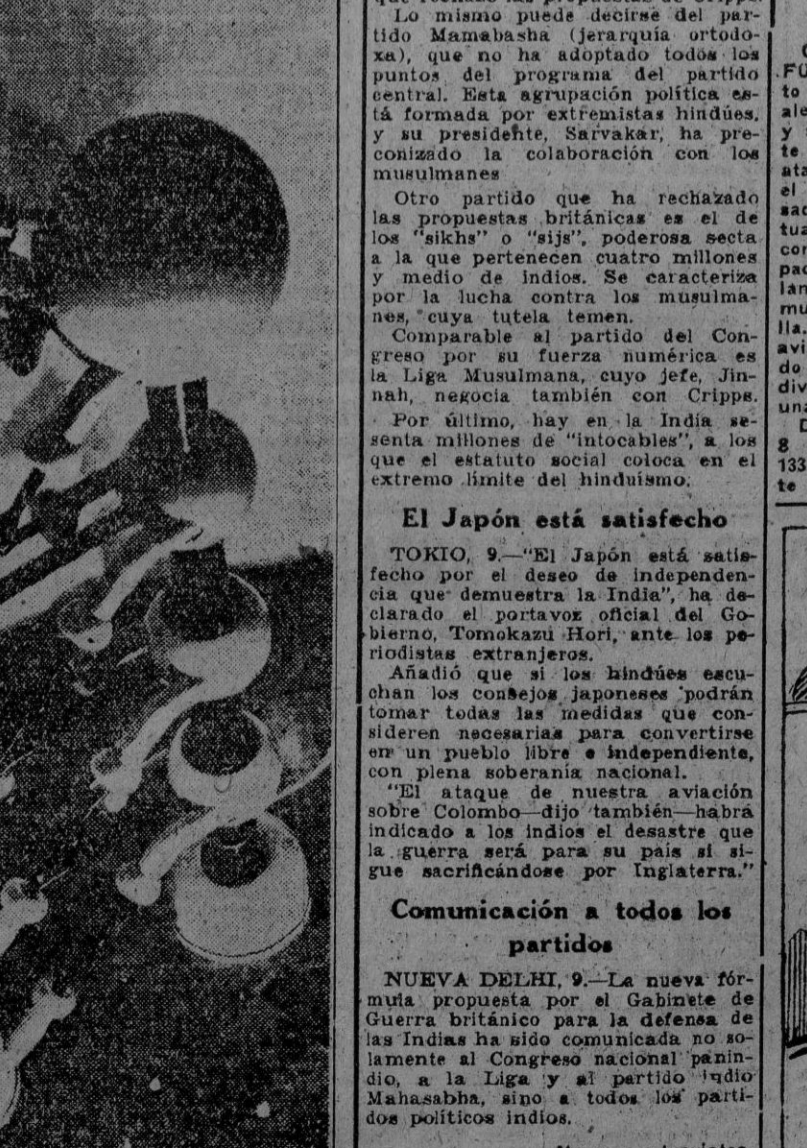
La Empresa Siemens ha construido una instalación para producir tres millones de voltios de constante tensión equilibrada. La fotografía ofrece una idea del gigantesco tamaño de la instalación.