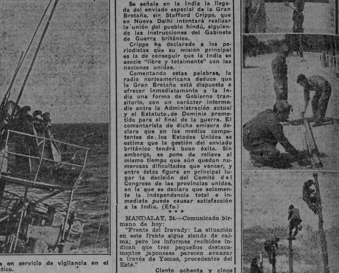
Buque ligero de la Flota alemana en servicio de vigilancia en el Atlántico.