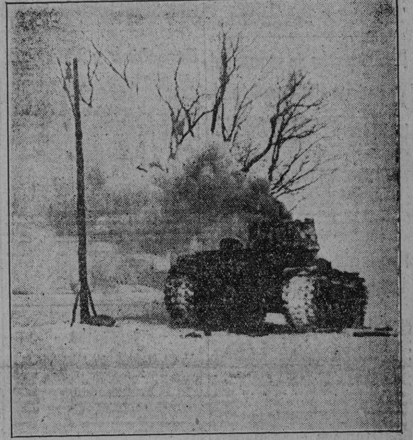
En la estepa helada los ataques soviéticos se estrellan ante la barrera infranqueable del Ejército alemán. Este tanque bolchevique ha sido inmovilizado e incendiado en el curso de un combate.