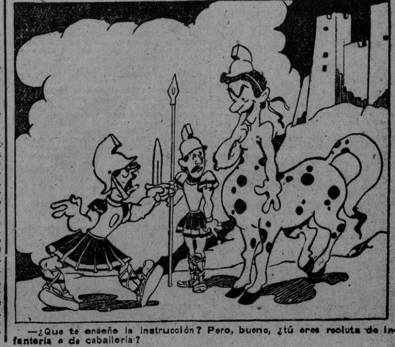
¿Que te enseñe la instrucción? Pero, bueno, ¿tú eres recluta de infantería o de caballería?