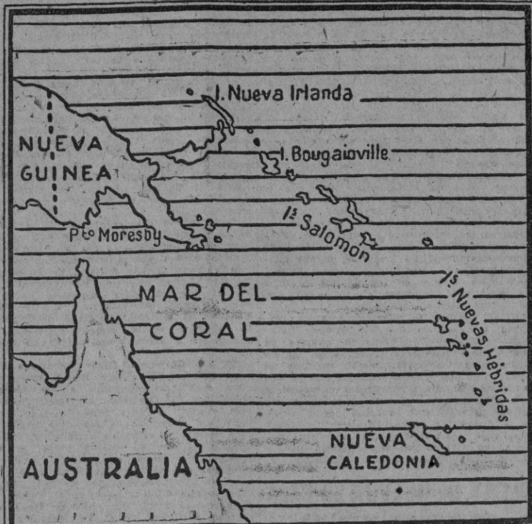
Como resultado de los ataques sobre las islas circundantes a Australia, las fuerzas japonesas han desembarcado en las islas Salomón...

Durante los años que siguieron a la guerra europea, la defensa del Continente australiano reposaba, como lo es la misma Gran Bretaña, en la seguridad colectiva ginebrina.