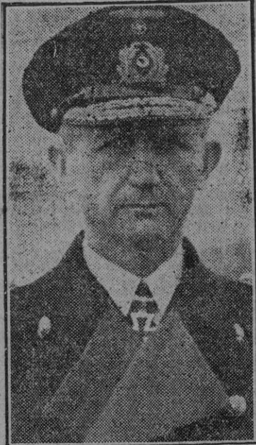
El comandante de los submarinos del Reich, contraalmirante Donnitz, ascendido a la categoría de almirante a propuesta del jefe supremo de la Armada del Reich, Raeder.