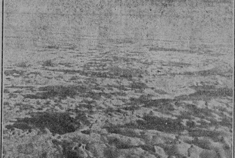
Un extenso campo de dunas en las cercanías de la costa africana del Atlántico.