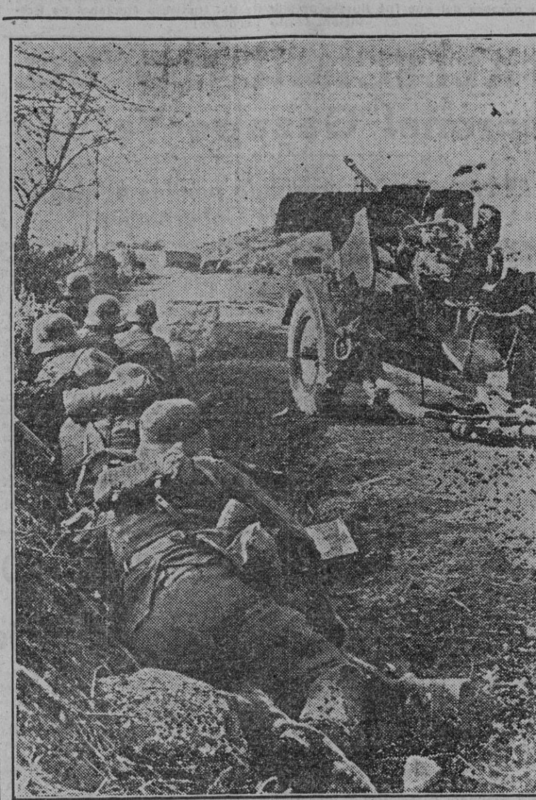
Tropas de choque del Reich cerca de Sebastopol, la ciudad sitiada.