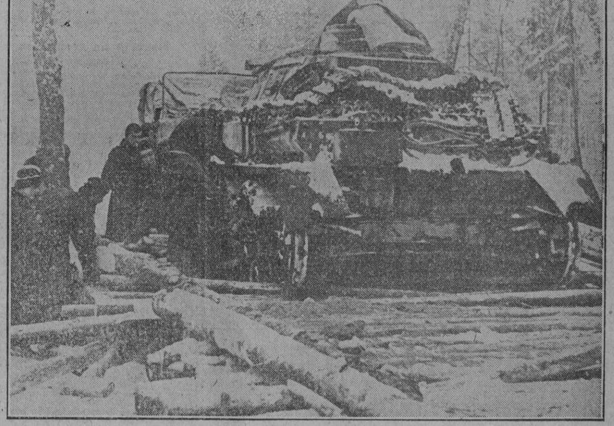
Para sacar de su inmovilidad a este tanque ruso capturado los soldados del Reich han tendido un puente de maderos que facilite su deslizamiento, no obstante la rotura de las cadenas de transmisión. (F. Weltbild.)