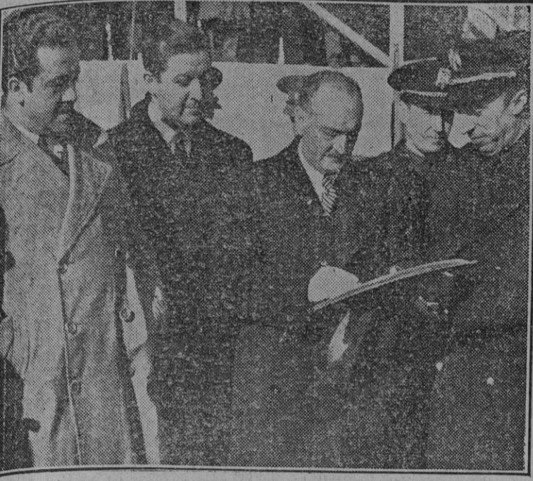
Los ministros de Trabajo y Obras Públicas en el acto de la inauguración de las obras para la construcción de 245 viviendas protegidas en Villaverde, celebrado esta mañana.