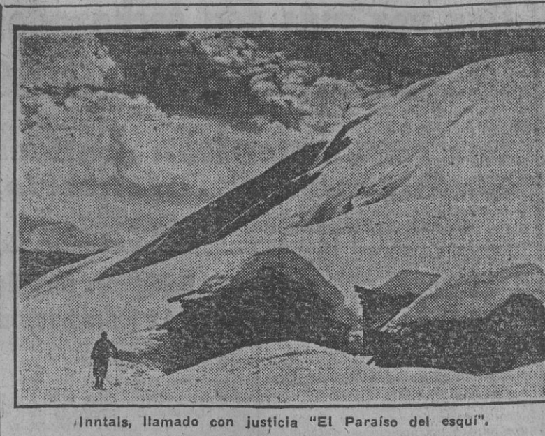
Intantá, llamado con justicia "El Paraíso del esquí".