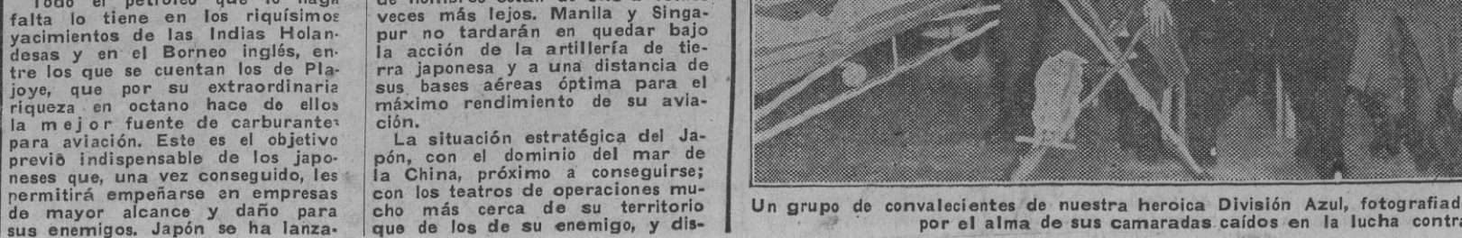
Un grupo de convalecientes de nuestra heroica División Azul, fotografiados a la salida de una misa celebrada por el alma de sus camaradas caídos en la lucha contra el comunismo.