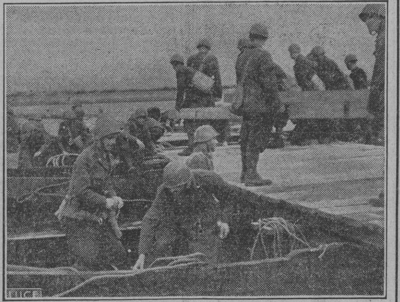
Los pontoneros italianos habilitan un puente de barcas sobre el Dniéper, soportando el fuego de los rojos parapetados en una de las orillas.