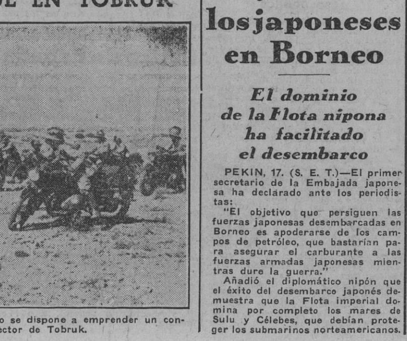
Un destacamento motorizado italiano se dispone a emprender un contraataque en el sector de Tobruk.

hoy y de mañana otros dos magníficos ejemplos de abnegación y de sublime sacrificio de la vida por su honor y el de la Patria al permanecer solos en sus respectivos buques después de ordenar el salvamento de sus tripulaciones y al unir su suerte a la de las unidades que mandaban, que lentamente engullían las aguas del “Mare Nostrum”.