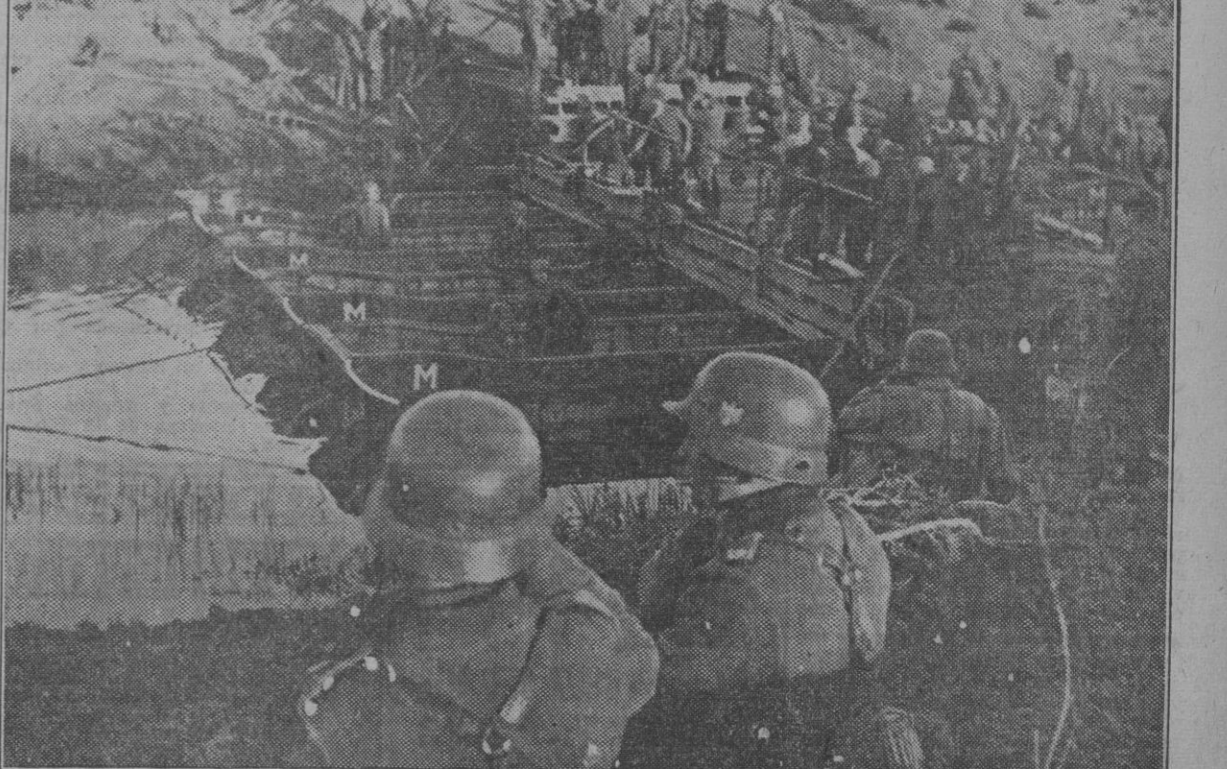
Los pontoneros del Ejército del Reich tienden un puente para facilitar el incesante avance de la Infantería.