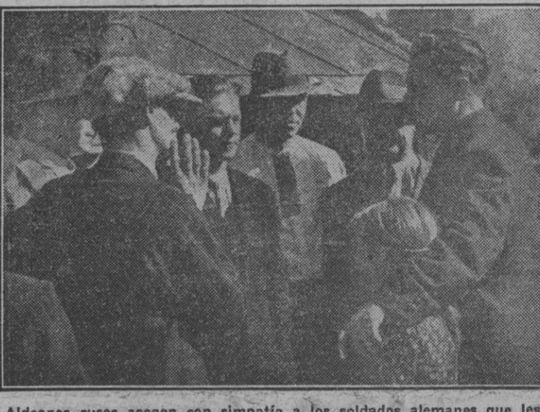
Aledeanos rusos acogen con simpatía a los soldados alemanes que les vuelven a la civilización