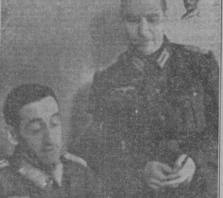
El jefe de la División Azul, Muñoz Grandes, con el jefe de su Estado Mayor, teniente coronel Romero, durante la preparación de una de las brillantes acciones realizadas por nuestros héroicos soldados...