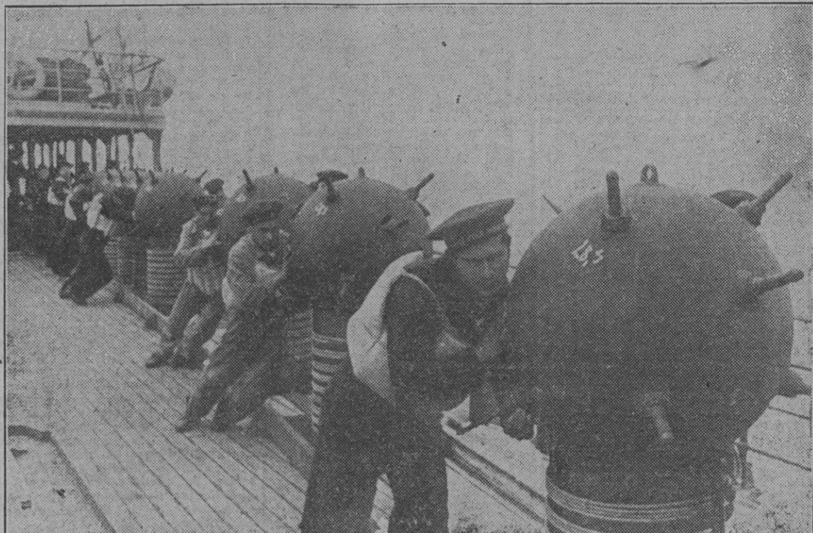
Los buques minadores van cumpliendo constantemente su misión de sembrar con los terribles artefactos las zonas marítimas en que más afectada resulta la navegación enemiga.