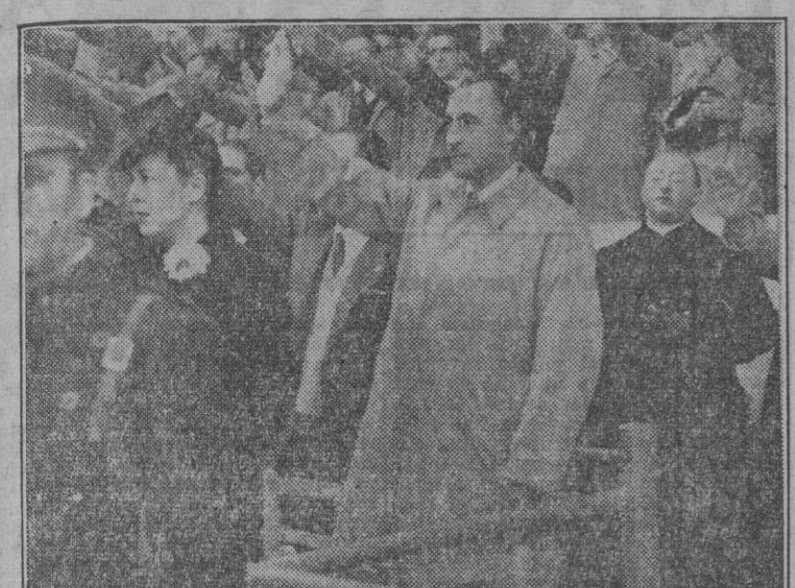
El ministro de Agricultura, camarada Primo de Rivera, escucha bravo en alto los himnos nacionales antes de comenzar el encuentro.