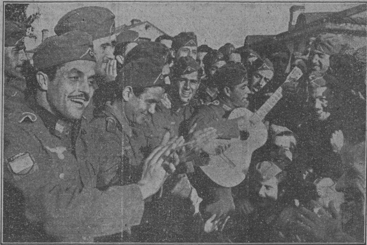
Ved aquí a los soldados de la División Azul. Ni las inclemencias del tiempo ni la dureza de la pesada que están empeñados han amortiguado la proverbial alegría de la tropa española. Ruego de guitarras, lánguidos lamentos de un canto que sale de la entraña popular y las brisas notas de una jota que jura a España y a la Virgen del Pilar triunfar sobre la horda cuate lo que cuate...