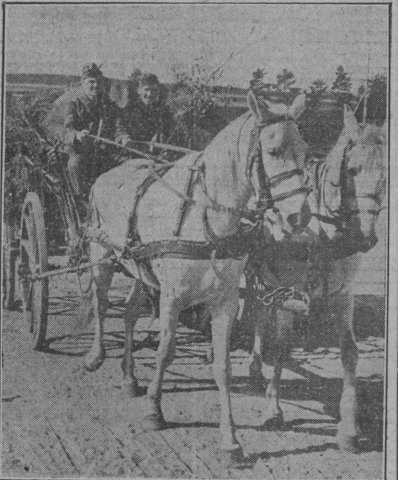
Con la sonrisa en los labios y en el corazón el ansia del choque con el enemigo, estos camaradas de la División Azul atraviesan en un vehículo los campos de Rusia. Visperas quizá y quizá paréntesis después del combate en que se ganaron tierras y glorias para la causa de la nueva Europa y de la destrucción del comunismo internacional.