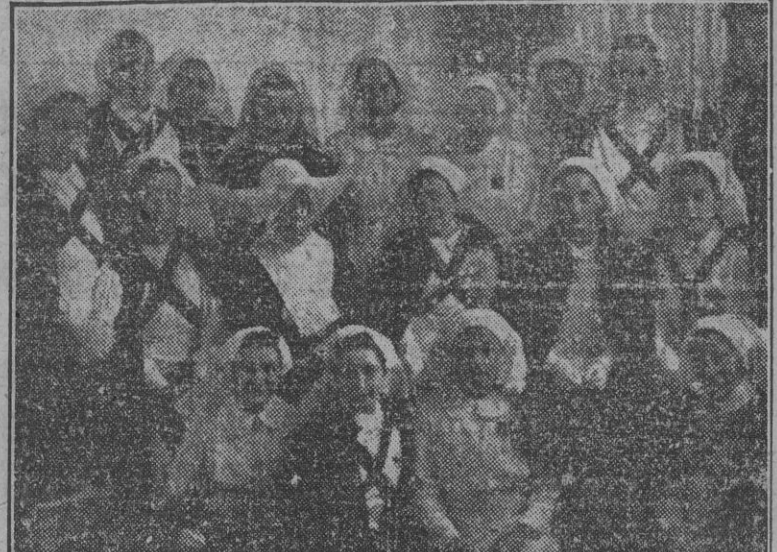
GRUPO DE ALUMNAS QUE HAN ASISTIDO A LOS CURSOS PARA LA OBTENCIÓN DEL TÍTULO DE ENFERMERAS DE LA CRUZ ROJA.