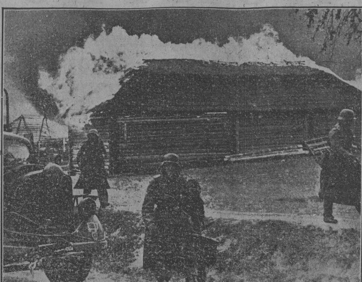
Como éste, cientos de fortines arden en el frente de Moscú.