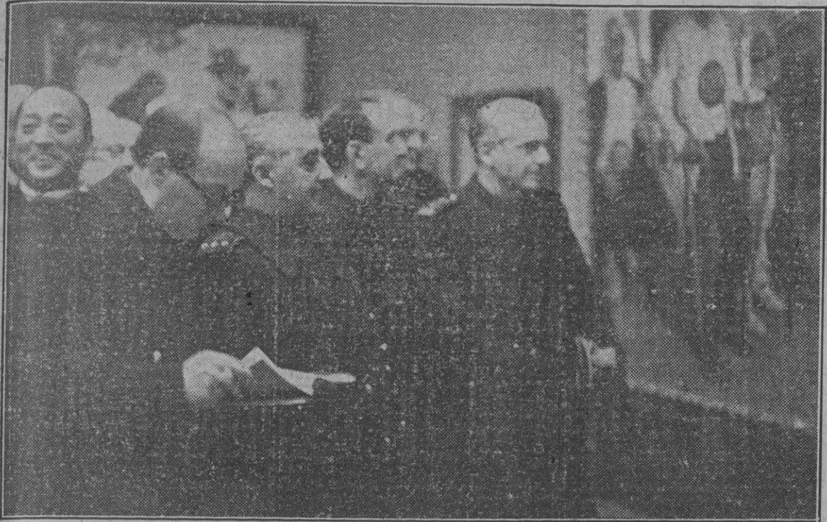
El Caudillo, con el ministro Presidente de la Junta Política, el ministro secretario del Movimiento y el ministro de Educación Nacional en una de las salas de la Exposición.

El público ovacionó con entusiasmo a Su Excelencia el Jefe del Estado