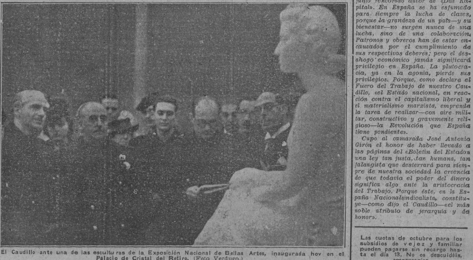
El Caudillo ante una de las esculturas de la Exposición Nacional de Bellas Artes, inaugurada hoy en el Palacio de Cristal del Retiro.