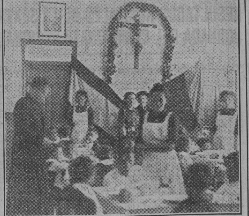
La hora de la comida en un Hogar Infantil de Auxilio Social.

Los hijos de las madres trabajadoras que por su edad no pueden aún ser iniciados en la vida escolar dentro de los Jardines Maternales, se atienden en las Guarderías Infantiles, donde reciben el alimento diario, y libros de texto, permaneciendo durante la jornada de trabajo de sus madres. Por medio de las Colonias de Recuperación, los niños de tierra adentro son trasladados temporalmente a playas de recreo, mientras que los del litoral conocen la vida de la montaña y participan