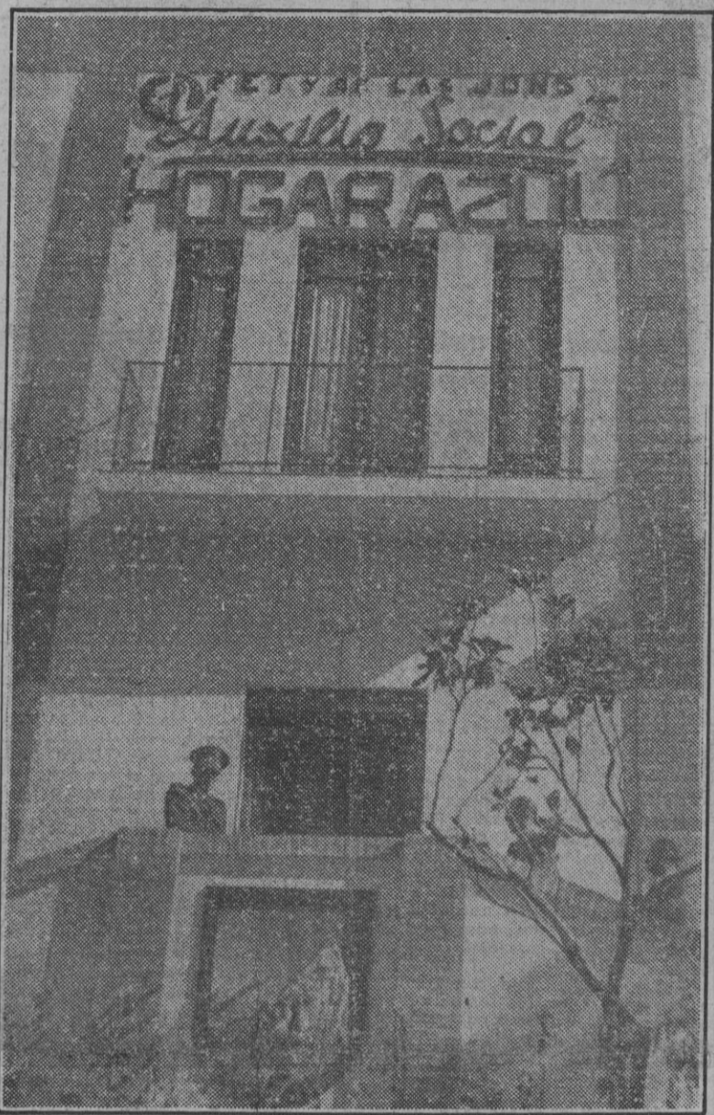
Fachada del Hogar Azul, situado en la Ciudad Lineal, y que ha sido inaugurado esta mañana por Auxilio Social, con asistencia de Su Excelencia el Jefe del Estado y los ministros Presidente de la Junta Política, señor Serrano Suñer, y de Gobernación, señor Galarza.