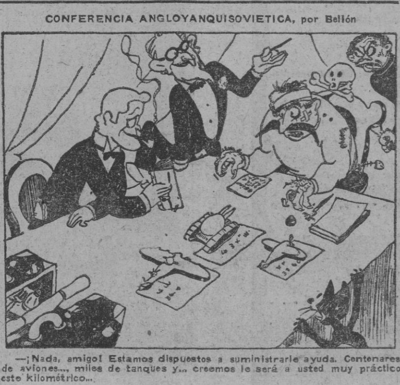
—Nada, amigo! Estamos dispuestos a suministrarle ayuda. Centenares de aviones... miles de tanques y... creemos le será a usted muy práctico este Kilométrico.

ROMA, 17.—Comunicado número 47 del Alto Mando de las fuerzas Italianas: "En el frente de África del Norte, sector de Gharda, se continúan acaes de nuestros destacamentos avanzados, que han efectuado reconocimientos y rechazado al adversario. Actividad eficaz de nuestra artillería contra las obras defensivas del frente de Tobruk. La aviación italiana efectuó nuevas incursiones sobre la ciudad de Trípoli, así como sobre Bengasi. No ha habido ninguna víctima; solamente ligeros daños materiales. Los aparatos alemanes e italianos atacaron las columnas motorizadas enemigas en la zona de Yarabub-Sia. Fueron alcanzados por las bombas y gravemente averiados numerosos vehículos motorizados del enemigo." (Efe.)